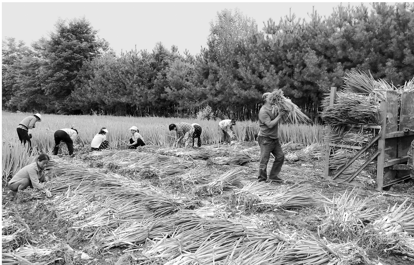
近日,清水县永清镇马沟村大葱种植基地的大葱丰收,工人们正在打捆装车,田野间洋溢着丰收的喜悦。

目前,岷县完成中药材种植面积68万亩以上,建设绿色标准化示范片带3个3.6万亩,建设500亩以上中药材绿色标准化种植基地60个以上,面积达30万亩以上。