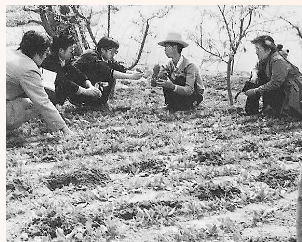
上世纪90年代,本报记者在兰州市的田间地头采访。