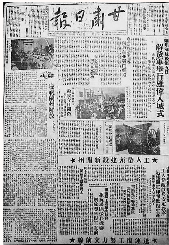
1949年9月1日,《甘肃日报》创刊,报头由彭德怀题写,图为《甘肃日报》创刊号。