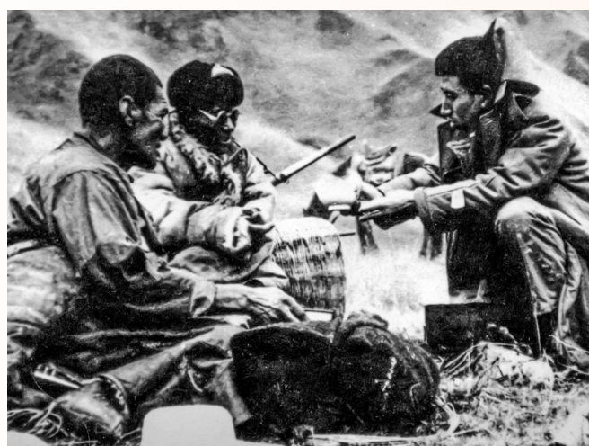
1972年,本报记者在海拔4000米的雪山草地采访时,和牧民同饮奶茶。