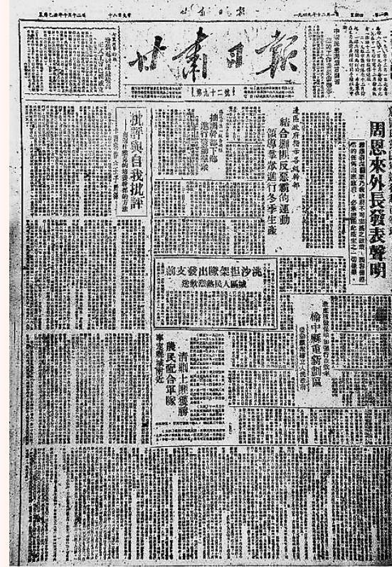
1949年12月1日,第一张由毛泽东题写报头的《甘肃日报》。