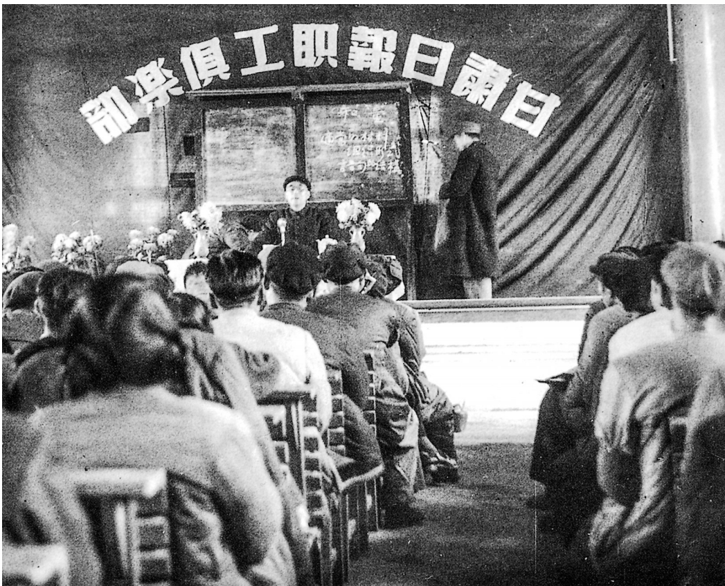
新中国成立初期,为提高新闻工作者文化素质,报社邀请了许多学者来讲课。图为叶圣陶在报社作《语言与语言教育》的学术报告。

莫耶原名陈淑媛,中华人民共和国成立后,任西北军区《人民军队报》主编、总编辑。1955年转业到甘肃日报社任副总编辑。1938年4月在延安创作的《延安颂》是其代表作之一。