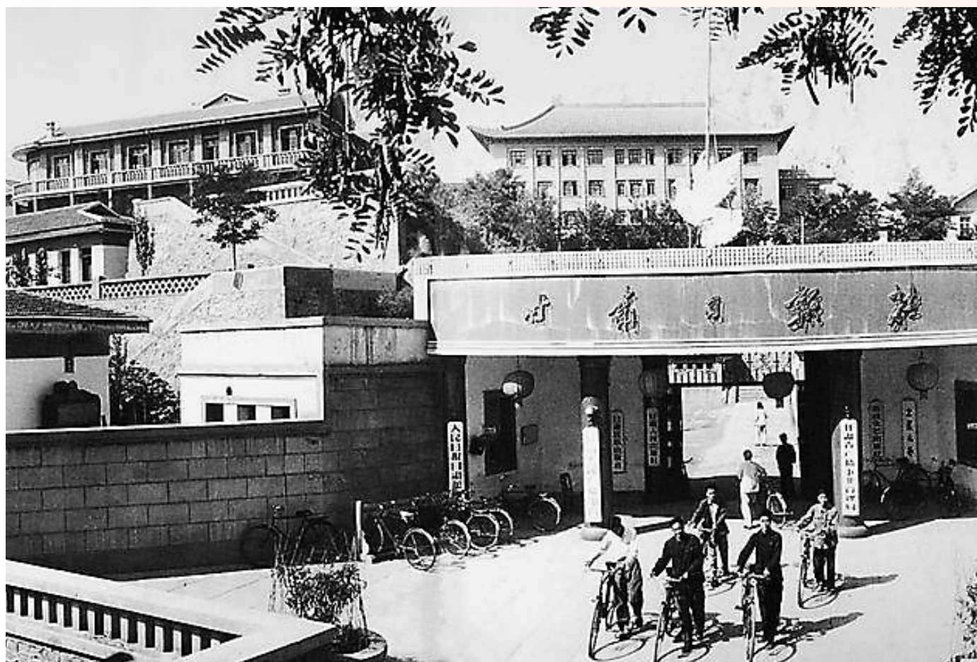
1954年7月开工兴建的编辑部大楼(大门正后方建筑)成为当时兰州的著名建筑之一。