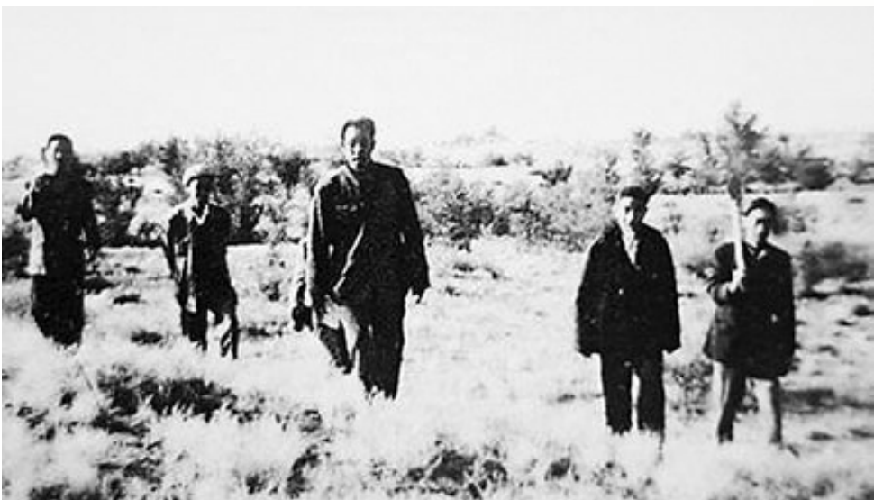
1990年9月13日,《甘肃日报》一版头条刊发消息《六老汉的头白了 八步沙的树绿了》,不仅获得了首届中国新闻奖三等奖,也使“六老汉”的事迹在陇原大地家喻户晓,成为全国治沙典型人物。从此以后,《甘肃日报》一直持续跟踪报道“六老汉”以及他们的后代防沙治沙的事迹,见证与记录着他们的脚步,他们的梦想。