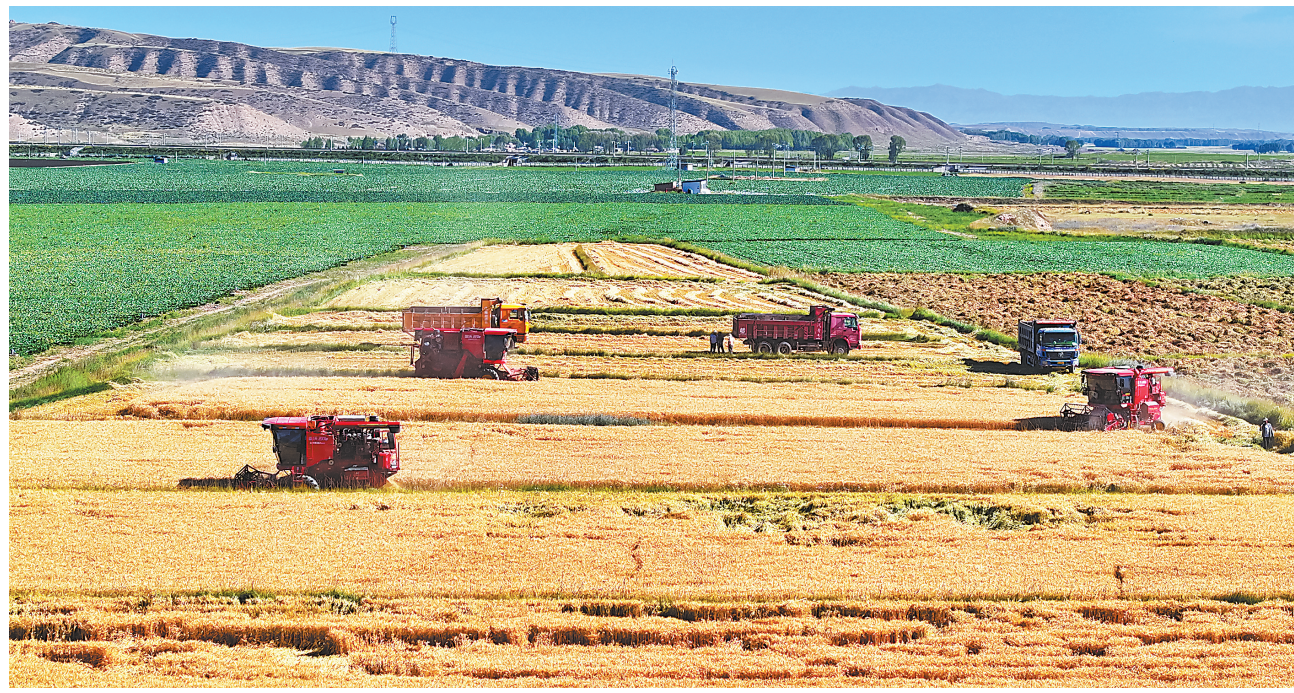
8月25日,联合收割机在民乐县永固镇八卦村收割小麦。

重难点控制性工程。 28日22时35分,记者在现场看到,随着一声令下,陇海铁路两侧的渭河特大桥梁主桥2号墩、3号墩连同桥墩上已浇筑好的桥面,开始缓缓沿顺时针方向转动。(转2版)