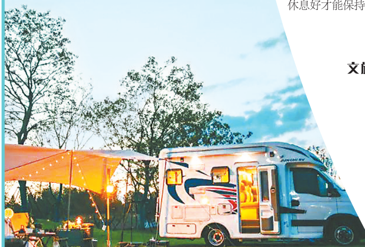
房车营地 (本版图片均为资料图)