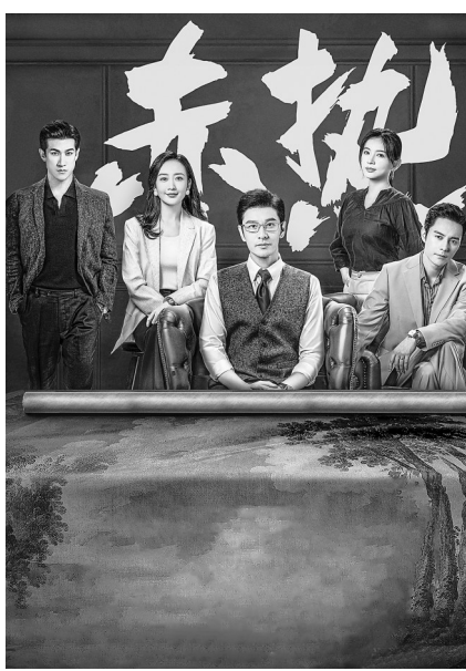
电视剧《赤热》主创团队合影

《赤热》是电视剧创作通过艺术创新回应时代议题的最新代表,体现出科技创新题材的创新性和纵深感,是一部难得的现实主义佳作。