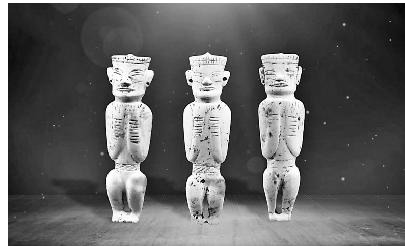
纪录片《探秘凌家滩》剧照

一束新石器时代的文明曙光,一个史前玉器的巅峰时代,一个五千多年前的古国……三十多年来,十五次考古发掘,三代考古人坚持不懈探索源远流长的中华文明,给予我们深沉的文化自信,让我们走进凌家滩,探寻中华文明的起源。 (综合)