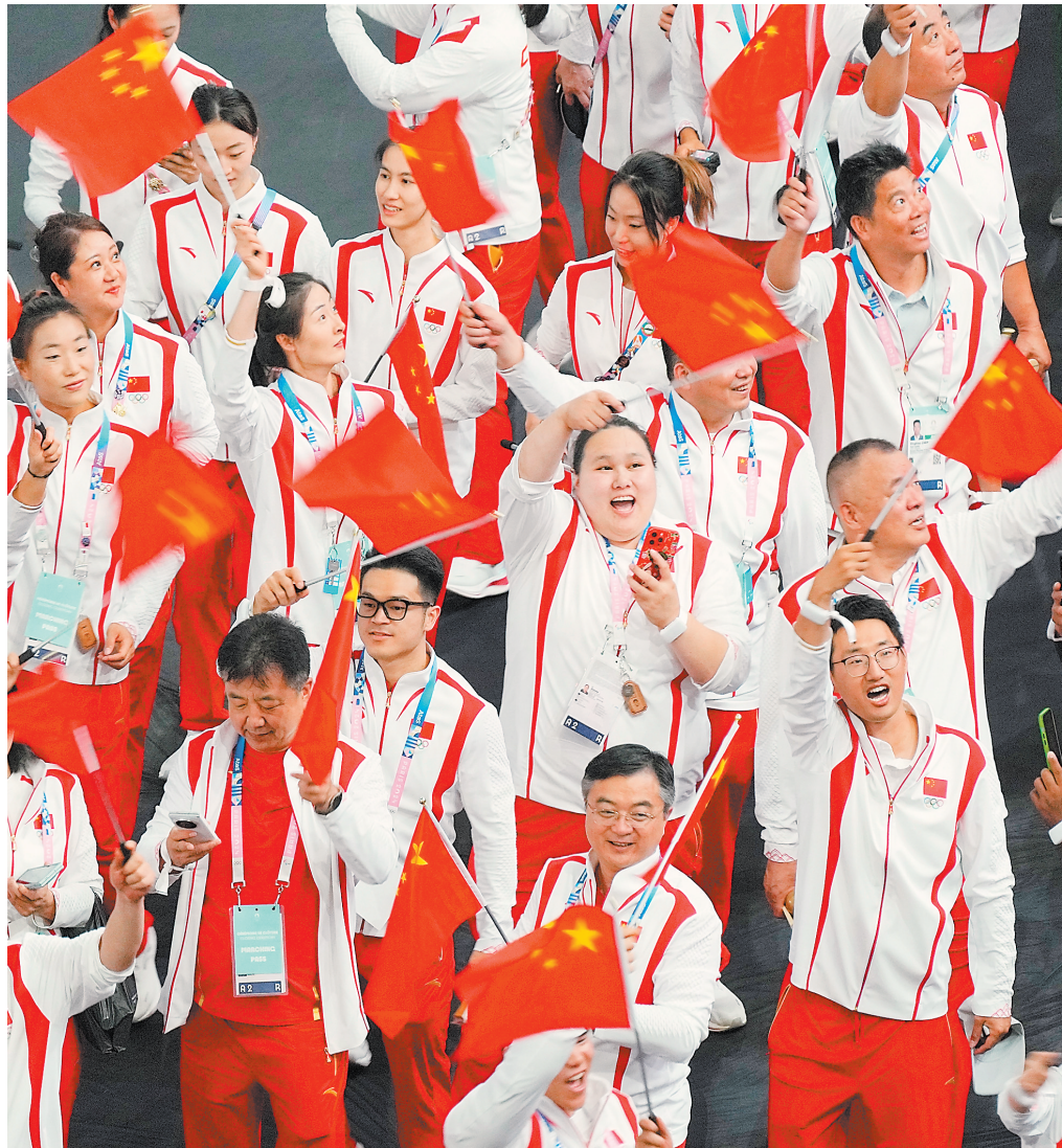
8月11日,中国体育代表团在闭幕式上入场。

创造新的历史,几大“王牌军”功不可没。除射击队创造最佳战绩外,中国跳水队首次包揽奥运会8金,中国乒乓球队也包揽5金,中国举重队6人出战带回5金……六大传统优势项目共获得27枚金牌,占代表团金牌总数的67.5%。