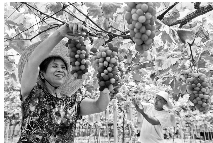
8月12日,浙江省金华市浦江县黄宅镇蒋才文村,村民在大棚里采摘葡萄。初秋时节,田野稻穗金黄,瓜果飘香,农民忙着收获劳动的果实。

中汽协数据显示,1至7月,我国新能源汽车产销量分别达591.4万辆和593.4万辆,同比分别增长28.8%和31.1%,新能源汽车新车销量达到汽车新车总销量的36.4%;出口新能源汽车70.8万辆,同比增长11.4%。