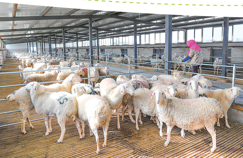
阿克塞县万只羊规模化养殖基地。高宏善