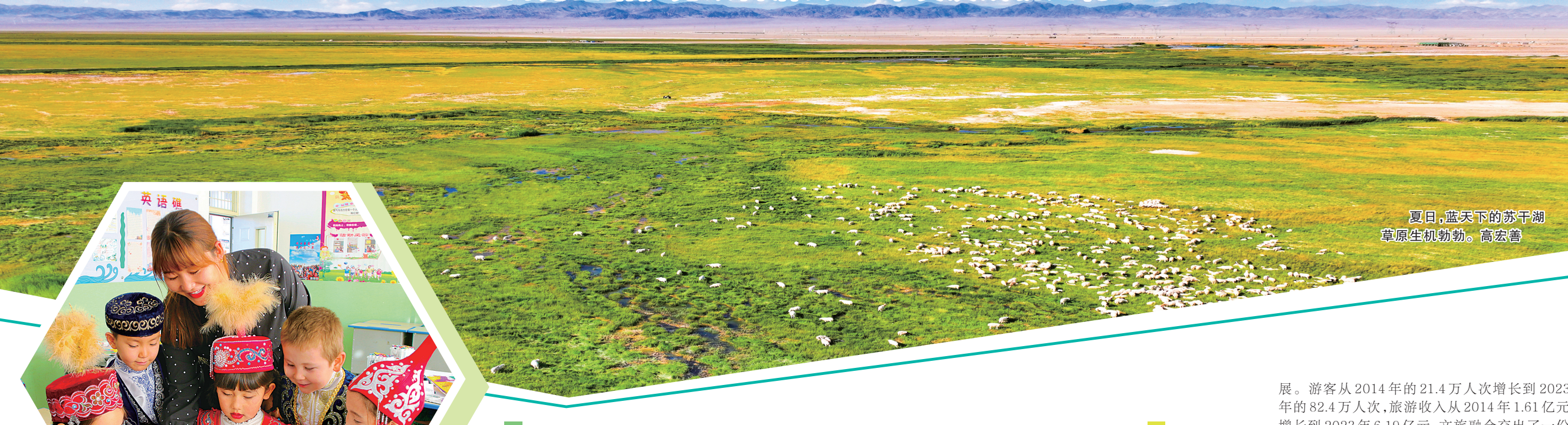
夏日,蓝天下的苏干湖 草原生机勃勃。高宏善