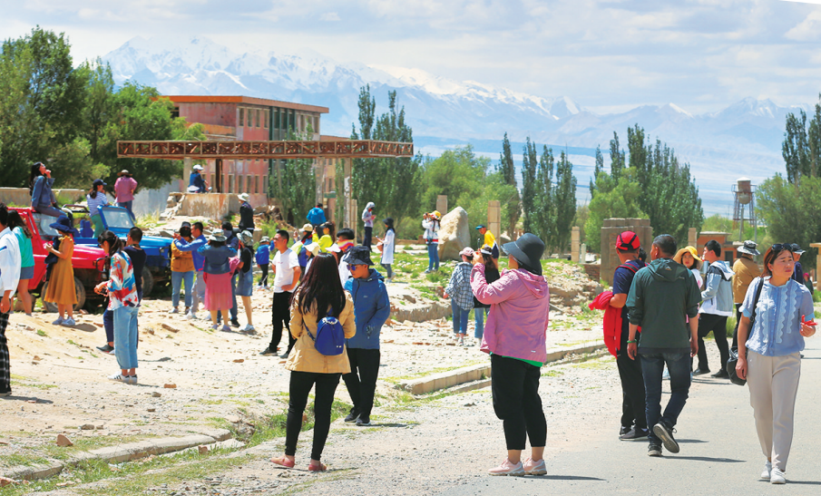
游客在阿克塞县博罗转井影视基地游玩。董文龙