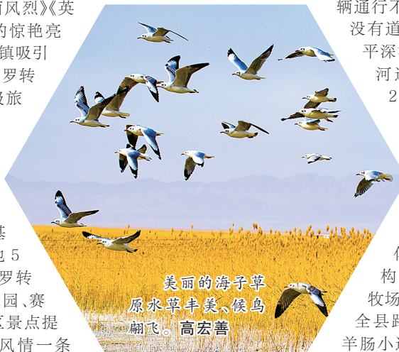
美丽的海子草 原水草丰美,候鸟 翩飞。高宏善

2018年,敦格铁路“敦煌—阿克塞—肃北”客运线正式投入运营;2022年,柳格国高(G3011)敦煌至当金山口公路全线通车,阿克塞县彻底告别不通火车、不通高速公路的历史。 70年来,阿克塞县公路总里程从25公里增长到2321公里,敦当高速和国道215线、571线(肃阿路)以及省道314线,呈“一纵两横”贯穿县境,成为连接新疆、甘肃、青海、西藏的交通主干道。 就业有岗位,增收有门路,医疗有保障,养老更贴心……70年的发展成果正展现在广大群众的笑脸上。 希望升腾,幸福满溢。回望来时路,阔步新征程,阿克塞县各族群众将手挽手、肩并肩,像石榴籽一样紧紧抱在一起,奋力谱写中国式现代化的阿克塞篇章。