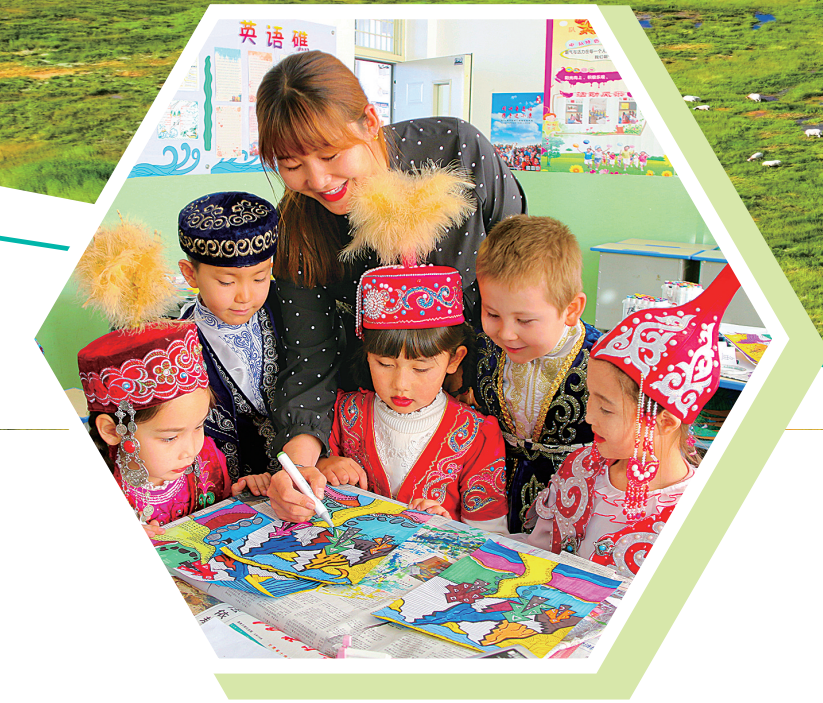
阿克塞县小学生在老师的指导下, 开展丰富多彩的假期活动。娜再拉