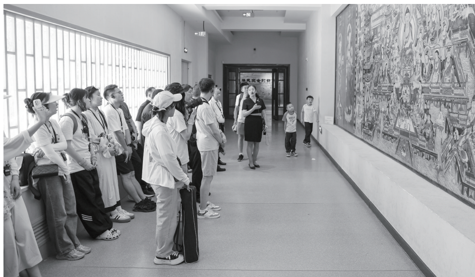
西北师范大学传媒学院“红色光影·敦煌行”暑期社会实践团参观敦煌博物馆。郭畅博

近日,由西北师范大学传媒学院硕士研究生组成的“红色光影·敦煌行”暑期社会实践团深入敦煌,用镜头捕捉敦煌艺术的独特魅力,共同体验了一堂深刻而生动的历史文化课程。