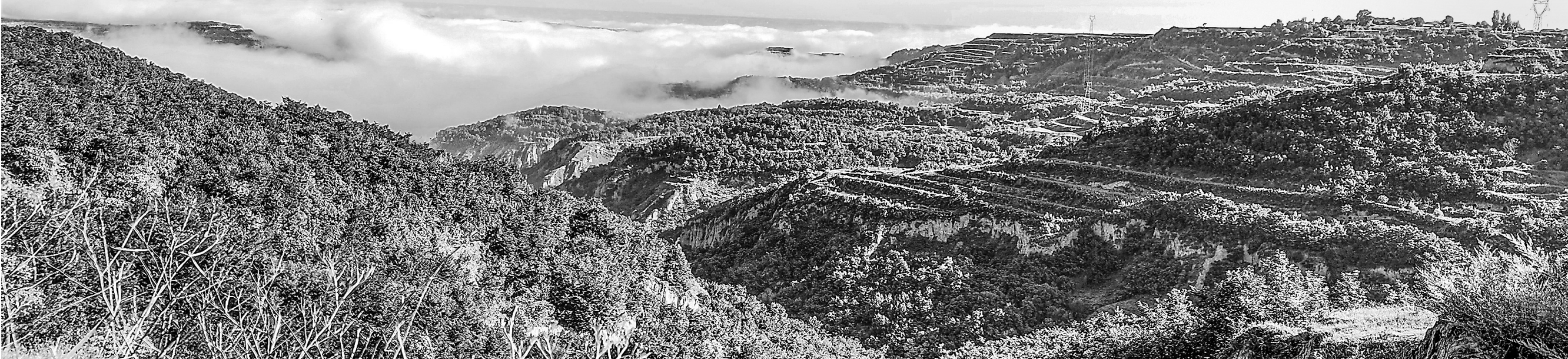
“四坡战斗”旧址。