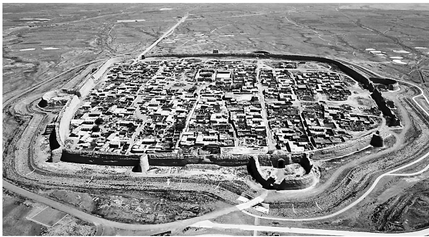
始建于明代万历年间的永泰古城 马宁

关于中华文明,有一个被人们经常提起的判断,就是中华文明是早期世界文化的几种“原生型文化”之一。而在世界上最初出现的几种“原生型文化”中,唯有中华文明没有出现过中绝现象,历经数千年而持续不断。