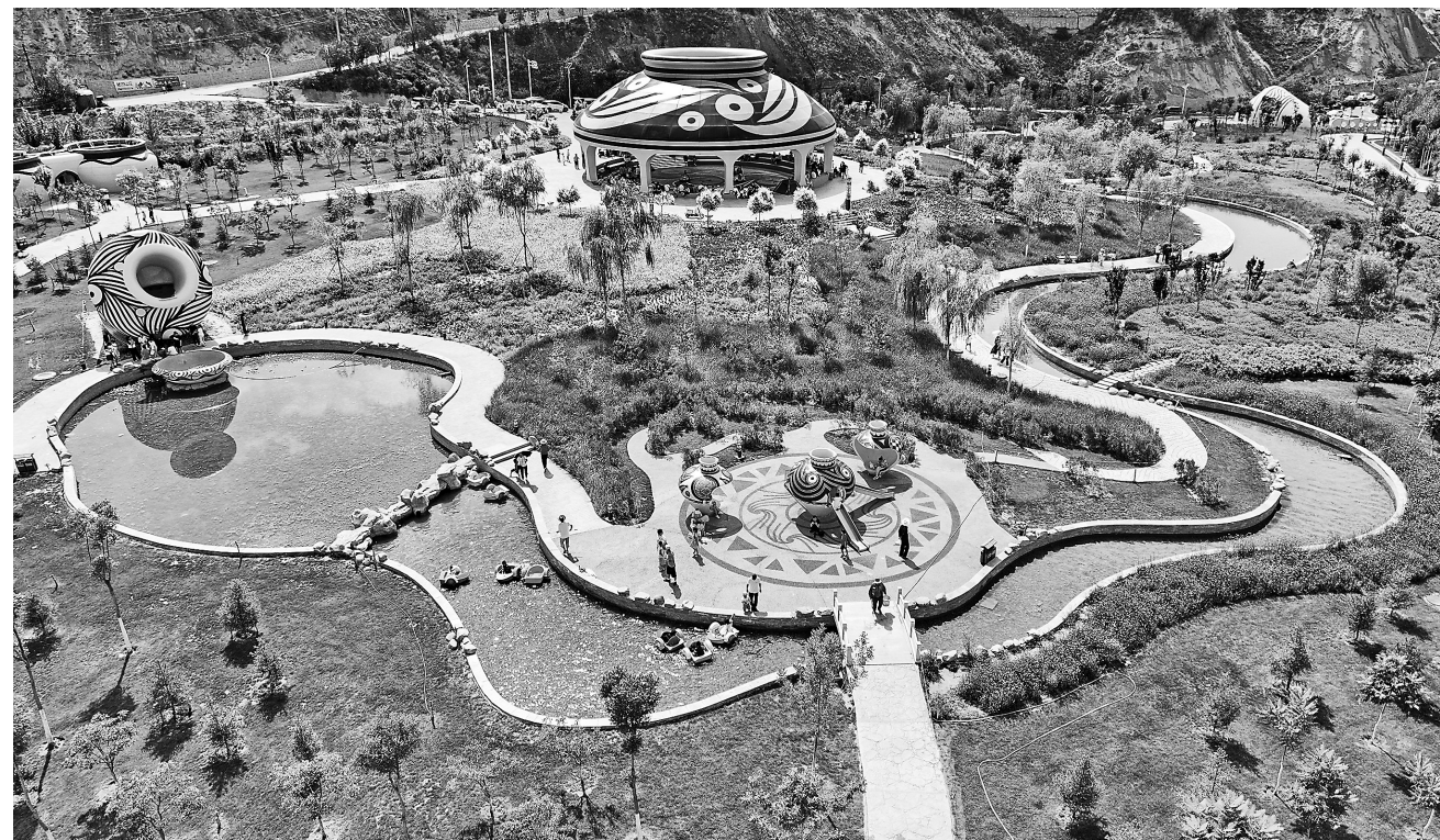
兰州彩陶博览园 田蹊