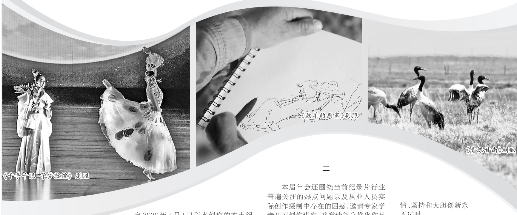
《千手千眼—寻梦敦煌》剧照