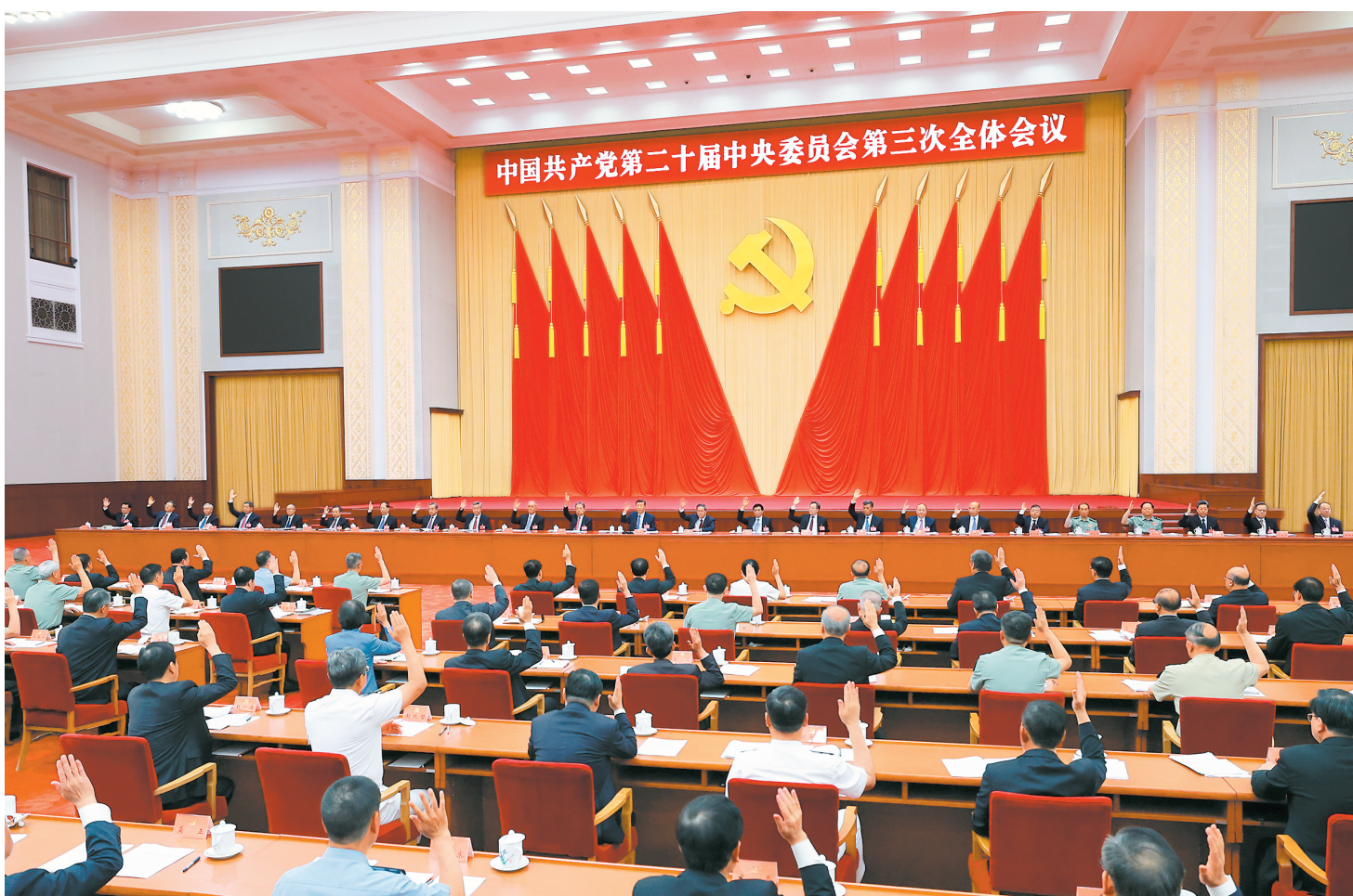
中国共产党第二十届中央委员会第三次全体会议,于2024年7月15日至18日在北京举行。中央政治局主持会议。 新华社记者 王晔