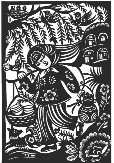
《陇原农耕图》(局部) 马路