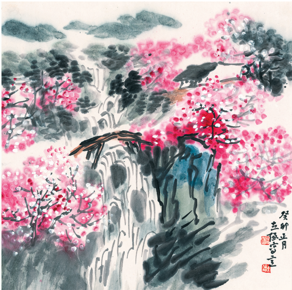
春日山居(中国画)杨立强