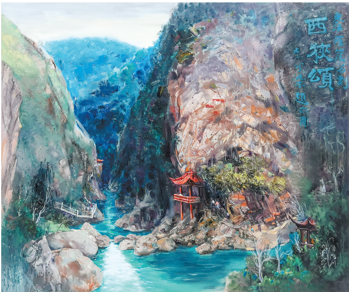
西狭颂(油画)高毅立