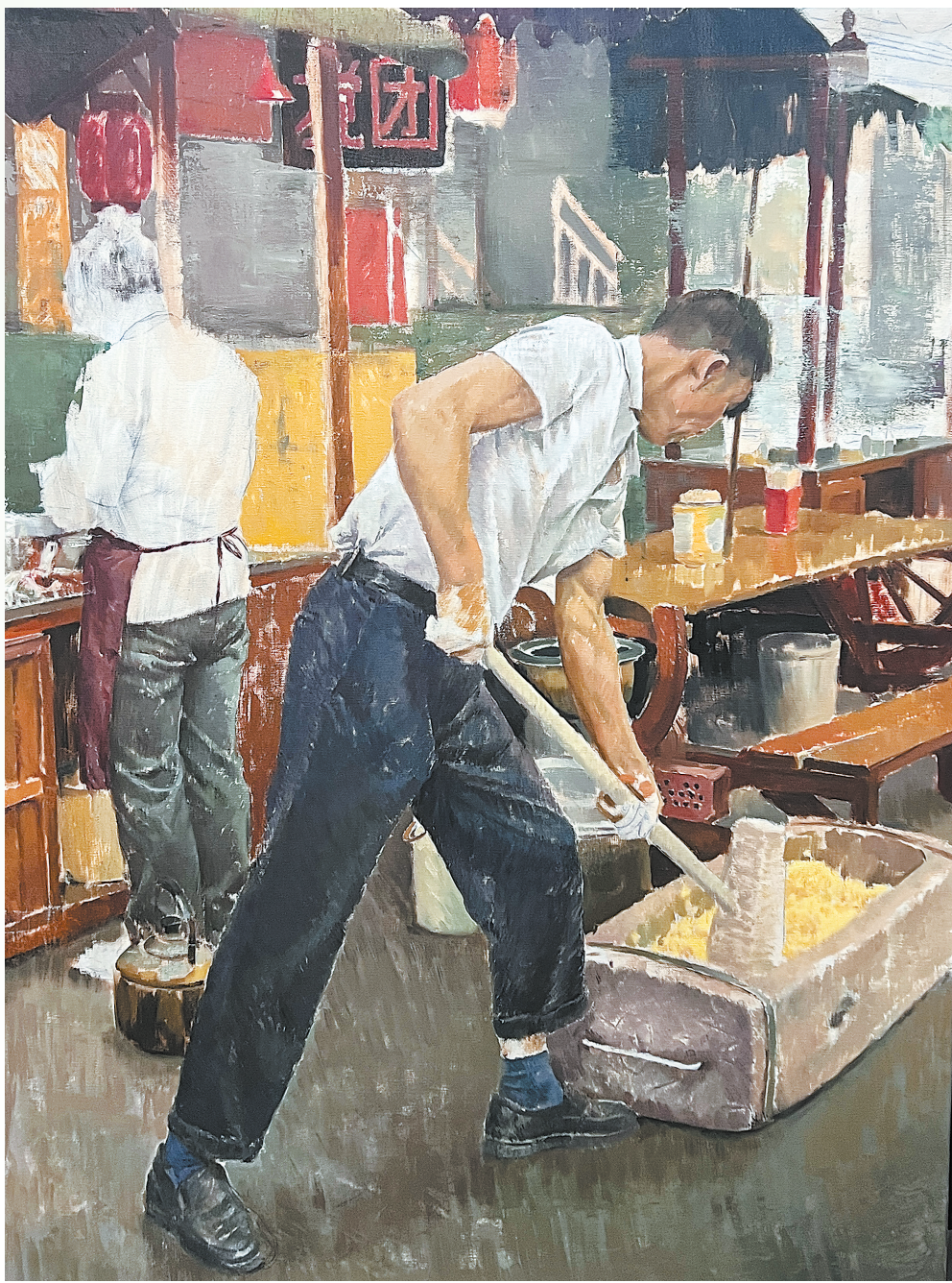
洋芋搅团的制作(油画)马博雯