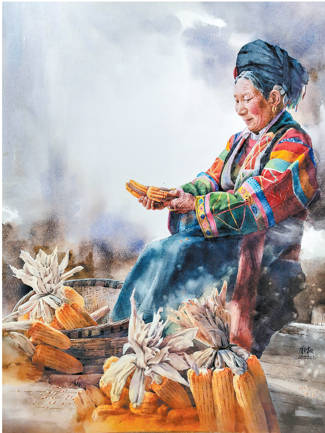
流金岁月(水彩画)张永权