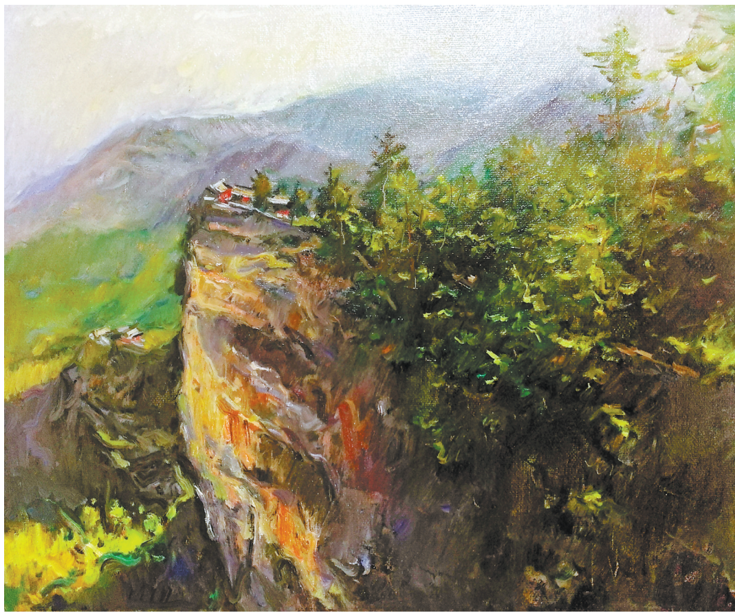
鸡峰暖阳(油画)魏强