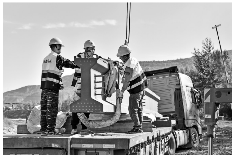
近日,临夏县黄泥湾镇境内G310线津河桥危旧桥梁改造项目首个超高性能混凝土工字梁成功吊装。

针对新鲜水果通关时限要求高的实际,天水海关畅通鲜活易腐农产品属地查检“绿色通道”,第一时间查验放行,为企业出具检验检疫证书,实现新鲜水果出口随到随报,即查即放,保障甜脆瓜抢“鲜”出口。