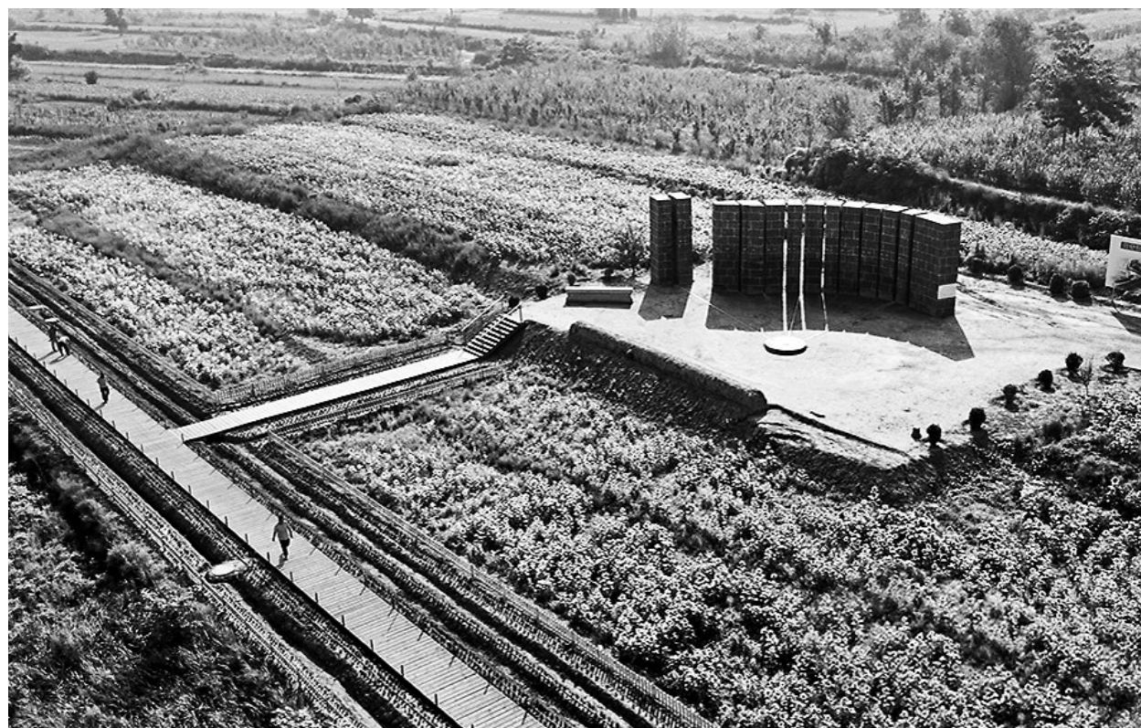
山西省襄汾县陶寺遗址观象台 资料图

中国传统文化发展中,天文学是非常重要的“母学”之一。诸多早期的神话故事其实都与天文相关,在传统的诗词