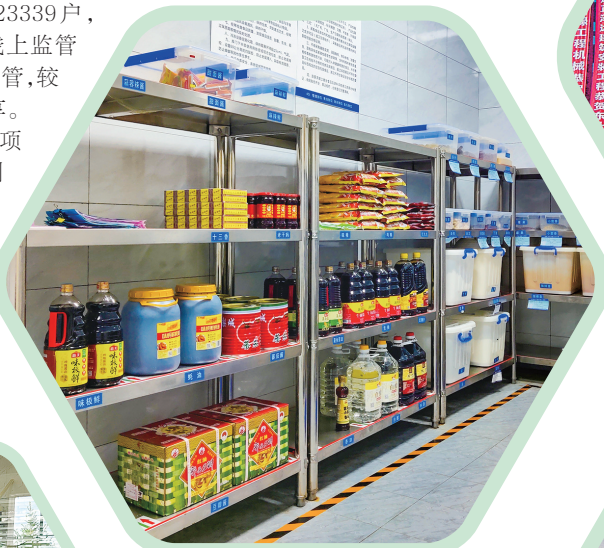
△灵台县职业中专食堂食品库房一角。