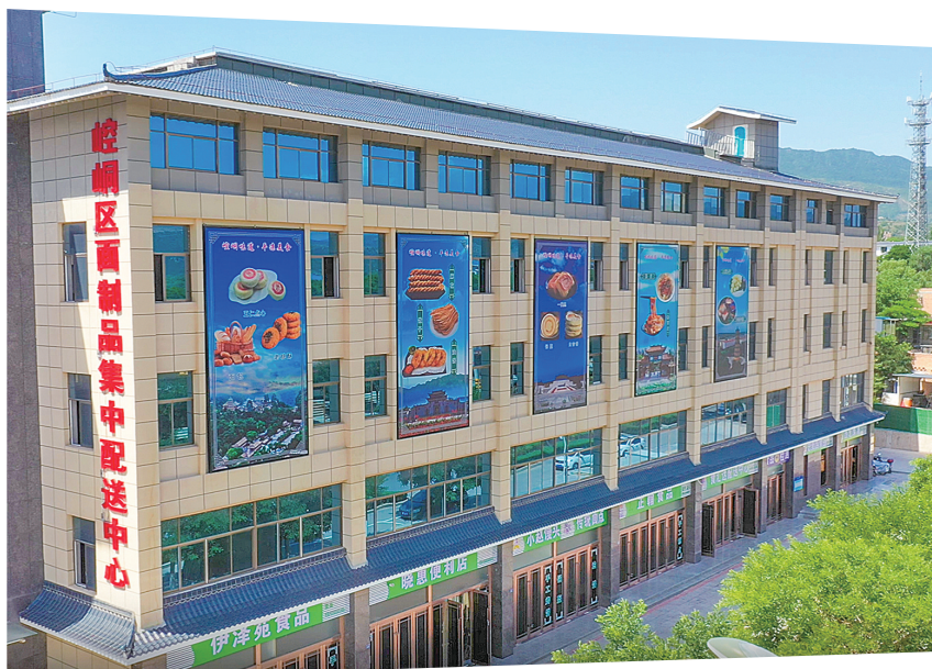
崆峒区面制品集中配送中心。