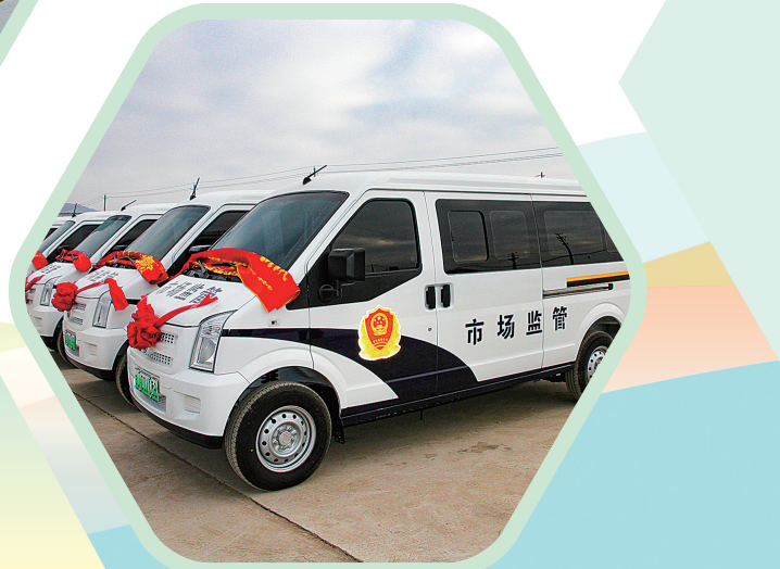
▷静宁县配发执法车辆现场。