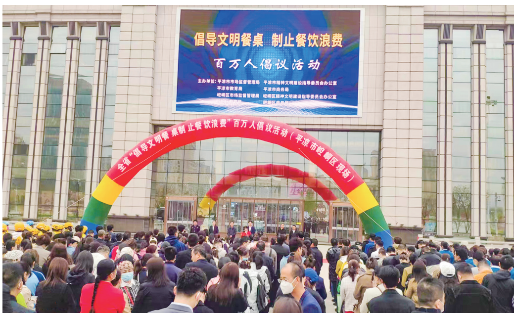
平凉市“倡导文明餐桌 制止餐饮浪费”百万人倡议活动现场。

在此基础上,平凉加强食品区域品牌建设,“平凉红牛”、“静宁苹果”入选国家农业品牌精品