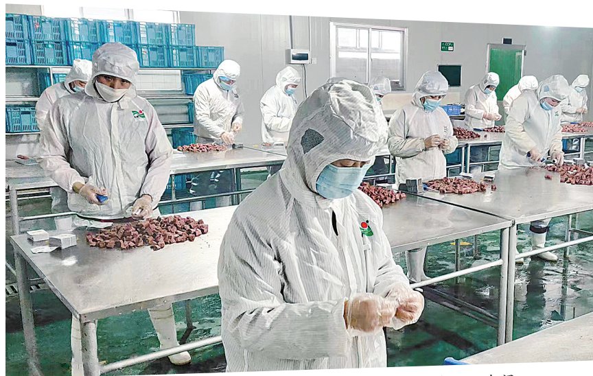
甘肃旭康食品有限责任公司生产加工车间。