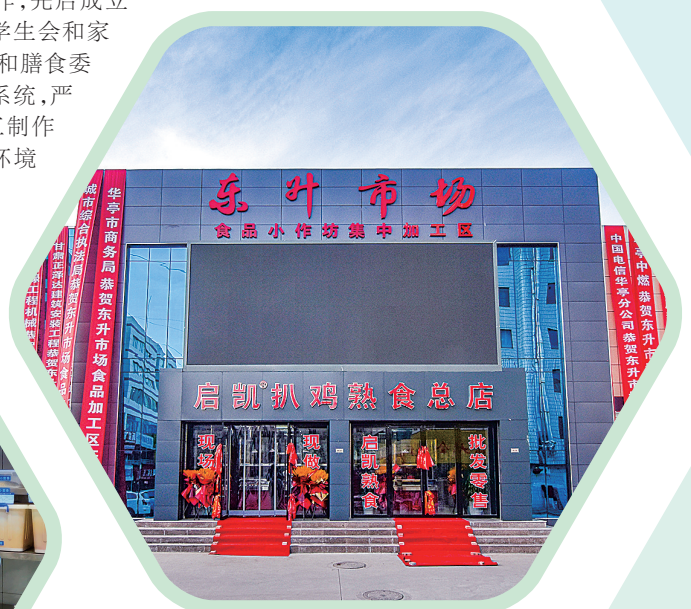
▽华亭市东升市场小作坊集中加工区。

创建只有起点,没有终点。平凉将以担当精神和严实作风,知重负重、攻坚克难,进一步完善食品安全治理体系,提高食品安全治理能力,全力打造社会认可、群众满意的“食安平凉”名片。