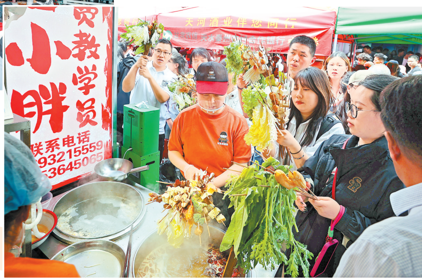
天水市四合院院内众多游客前来品尝麻辣烫。