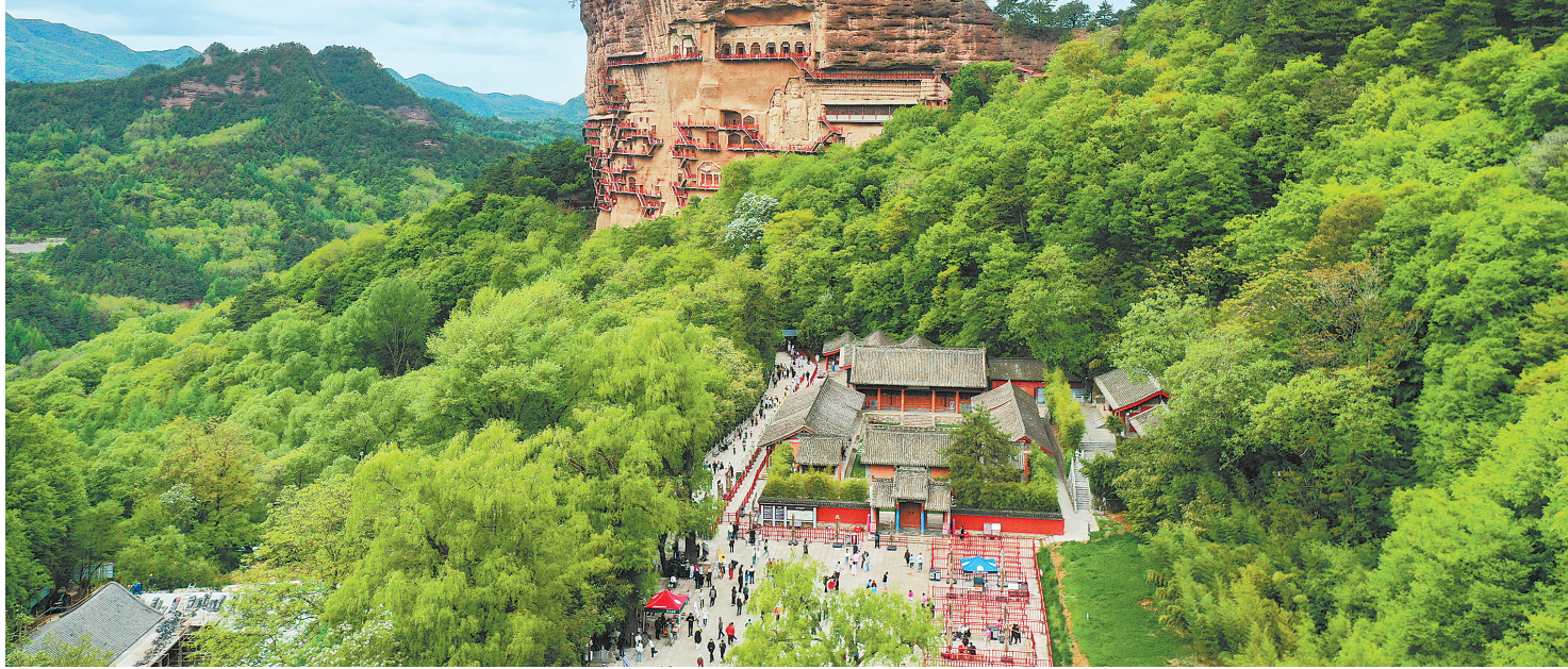
天水市麦积山景区。

辣,热度很快会过去。于是,一套全城动员和全省联动的“组合拳”打了出来。甘肃省文旅厅组织各市州以文艺演出方式分批次、按节奏、多形式助力天水,并策划开展甘肃麻辣烫及特色美食大PK、文创非遗市集展销、“春绿陇原”文艺展演等系列“宠粉”活动和暖心之举,既为天水“加油”,又为各地宣传引流。同时,天水全面挖掘当地文艺演出资源,3月份至今已举办750多场次演出活动。