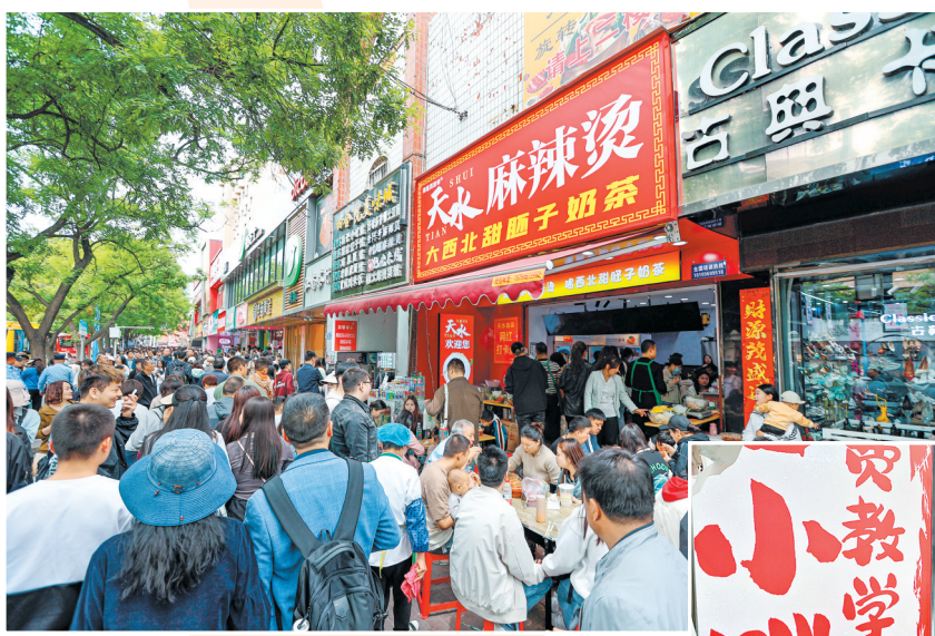
游客在天水市秦州区一家麻辣烫店外排队就餐。