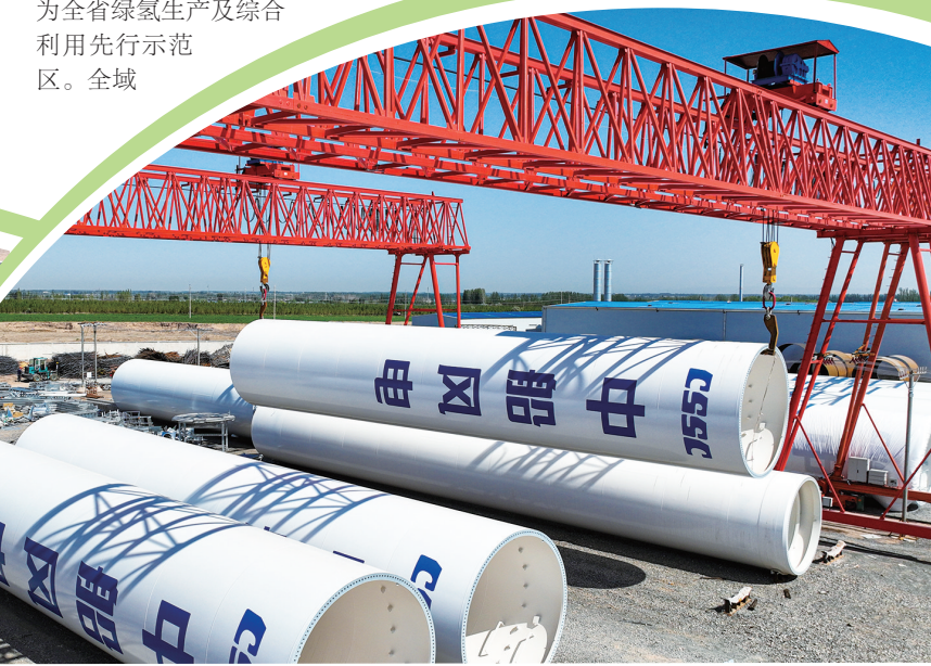
位于高台县的甘肃创腾电力装备有限责任公司,一个个钢筒或被缓缓吊起或有序摆放,准备运往安装现场。