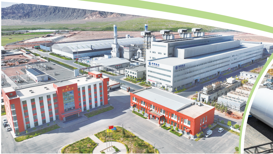
位于甘州区的甘肃河西硅业新材料有限公司。