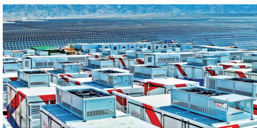
山丹县中昂源能源科技250MW/1000MWh独立共享储能项目。