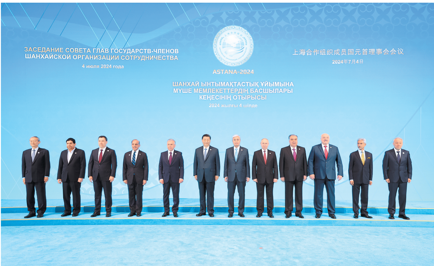
当地时间7月4日上午,国家主席习近平在阿斯塔纳独立宫出席上海合作组织成员国元首理事会第二十四次会议。这是习近平同上海合作组织成员国领导人集体合影。