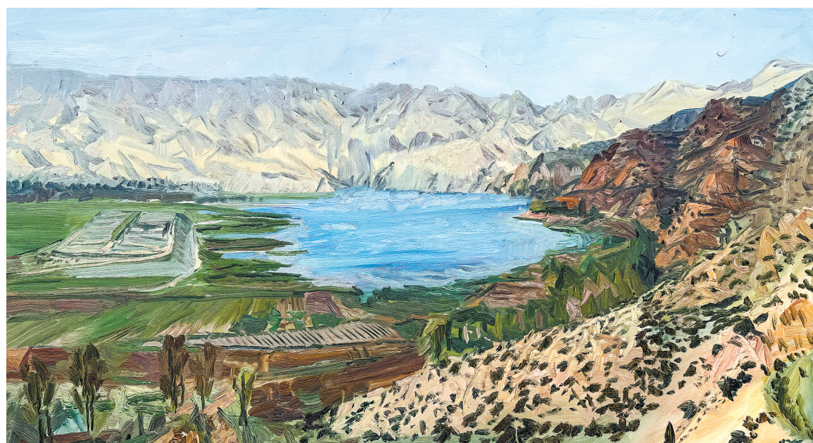
天梯山石窟远眺 张路江