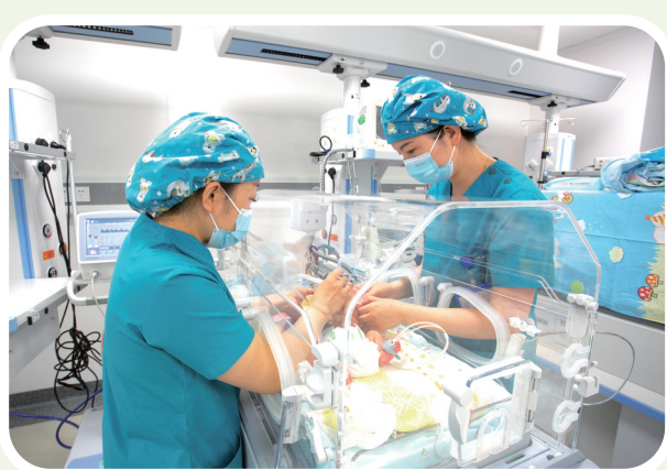
护士在新生儿救治中心护理新生儿。