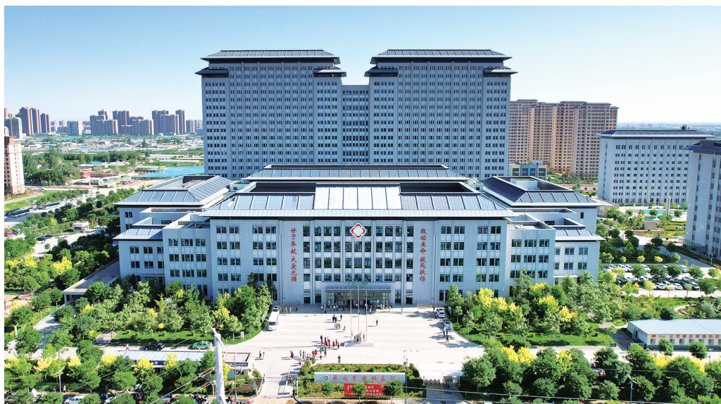
蓬勃发展的武威市凉州医院。

七十三载风雨沐， 七十三载春华秋实。 73年来，一代代凉医人，不忘初心、开拓进取，探索出了一条“市区结合”的特色办院之路，并成功晋级三级甲等综合医院。