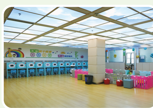
武威市凉州医院儿童输液中心。