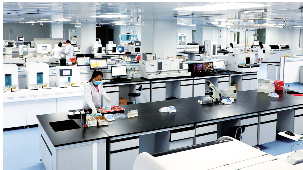
武威市凉州医院医学检验中心。