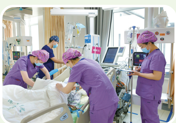
武威市凉州医院重症医学科医护人员在抢救病人。

新征程上，凉州医院将坚持以人民健康为中心，不忘医者初心，牢记医者使命，以坚如磐石的信心、只争朝夕的劲头、坚韧不拔的毅力，努力拼搏，担当实干，围绕医疗服务、学科发展、人才建设、管理保障等方面，加力奋进，为健康武威建设贡献力量。