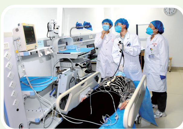
武威市凉州医院内镜中心。