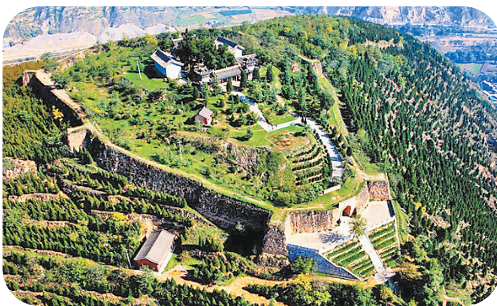
卦台山远景(本版图片均为资料图)

卦台山伏羲庙与天水市区伏羲庙遥相呼应、双祠并峙,卦台山附近有女娲遗迹等,这些都是天水伏羲文化的重要组成部分。近年来,随着公祭伏羲大典影响力的不断增强,作为天水著名风景名胜和“羲皇故里”历史见证的卦台山伏羲庙也频频“出圈”。对卦台山伏羲庙这一文化遗址建筑美的探讨,不仅可以获得丰富的审美体验,更可感受到天水地区伏羲文化的厚重绵长。