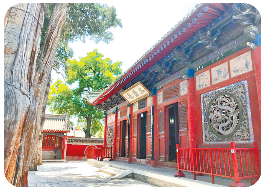
伏羲庙内的太極殿