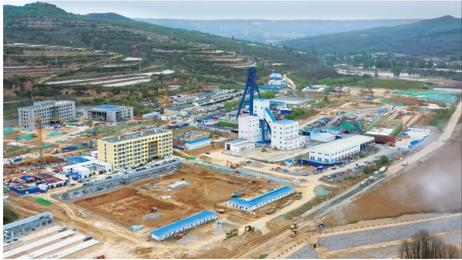
甘肃银行信贷支持的崇信县五举煤矿300万吨年产能提升建设项目。