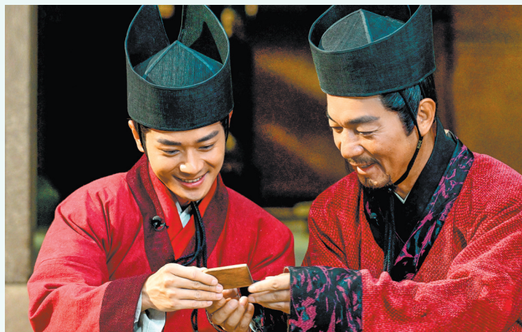
《简牍探中华》之《居延汉简》实景戏剧场景

谓“明天田”?居延汉简告诉我们,人工铺就的天田表面疏松,通常处于汉代边塞外侧,人、畜经过后容易留下痕迹,因此需要每天派吏卒巡察。为保障效果,负责巡察的吏卒抵达边界后必须“打卡”报到,并以“日迹”的形式将具体情况记录下来并逐级上报。详细周密的屯戍制度是汉代经略边疆的重要举措,很好地保障了边塞的安宁,让观众安居乐业,也促进了丝绸之路的繁荣。