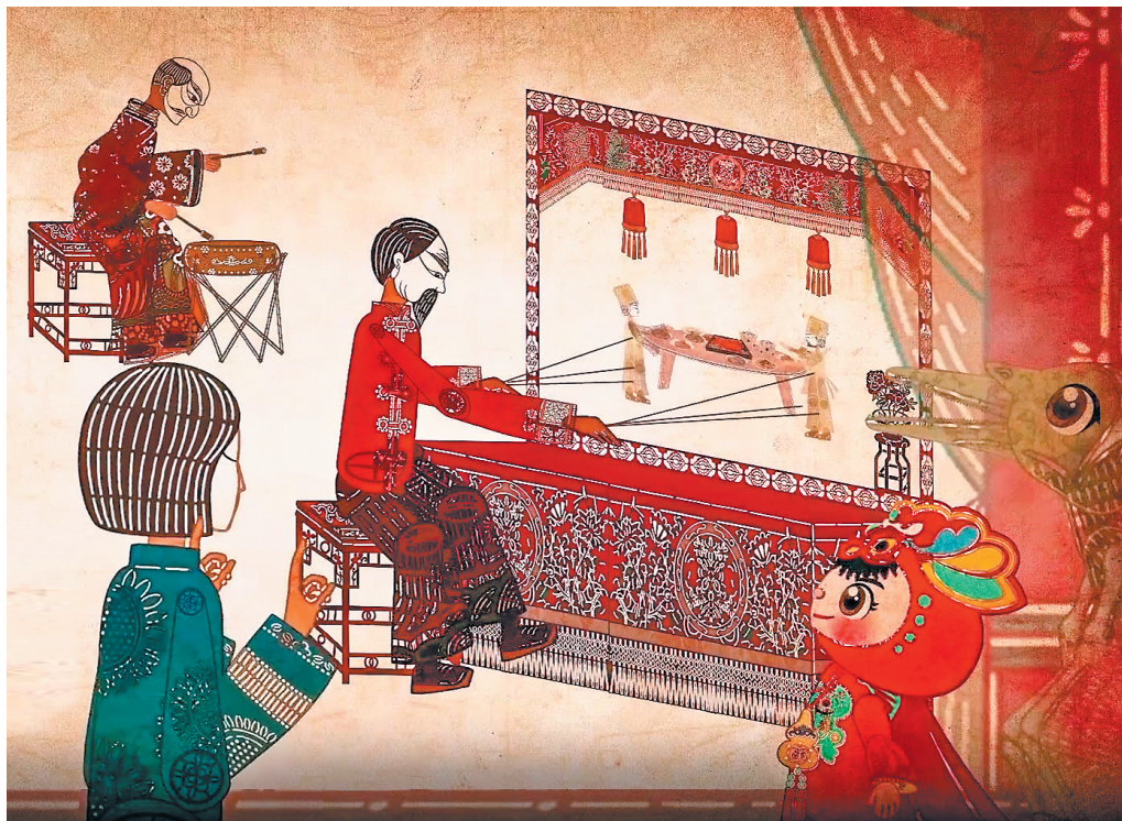
《香宝宝庆游记》剧照

总之,《香宝宝庆游记》是一部集剧情、角色设计、艺术风格、文化内涵于一体的动漫作品,为观众带来了一场独特的视觉和心灵体验。