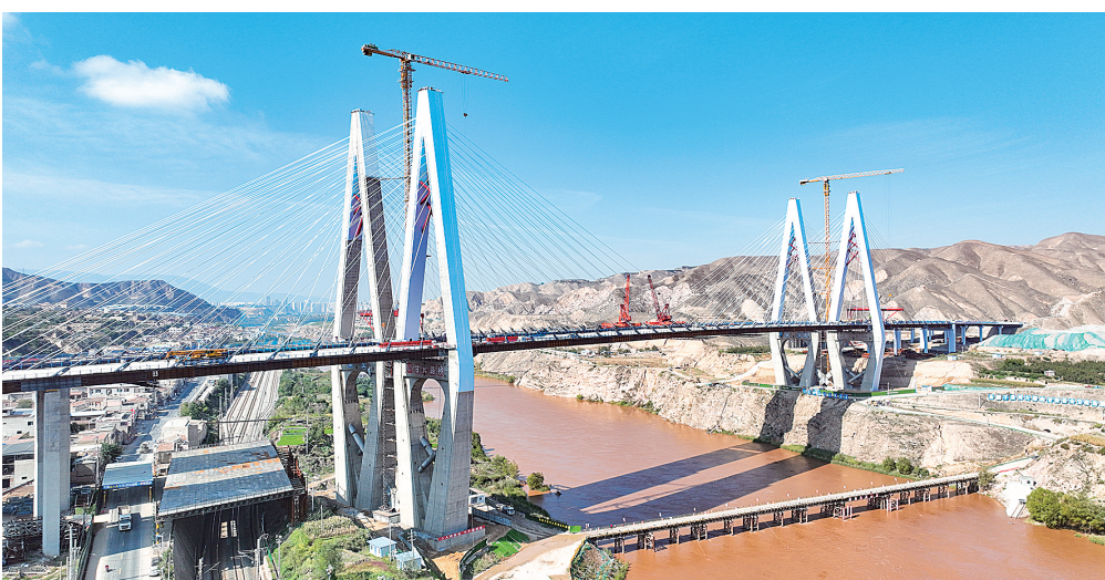
建设中的G312线清水驿至傅家窑公路桑园子黄河大桥控制性工程。

党的十八大以来,甘肃路桥全面落实“创 建一流企业、实现一流管理、建设一流工程、创 造一流效益”的经营管理方针,实现高质量跨