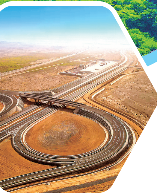
△甘肃路桥承建的七瓜、马桥一级公路, 是甘肃省首条采用委托—建设—运营(EBO) 模式建设的公路项目。

在兰州新区产业园,13款改性沥青和快 速修复材料系列新产品,5套以“Novachip超薄 罩面”为代表的施工新技术相继面世,改性沥青 年生产能力达30万吨以上,产品畅销省内外,累 计销售额超50亿元;胶粉、橡胶复合改性沥青、 废轮胎(橡胶)热裂解3条废旧橡胶综合利用生 产线实现变废为宝,活化胶粉、橡胶锥桶、炭黑、 燃料油、回收钢丝等产品正昂首走向市场,路 衍经济产业对企业发展贡献率正进一步提升。