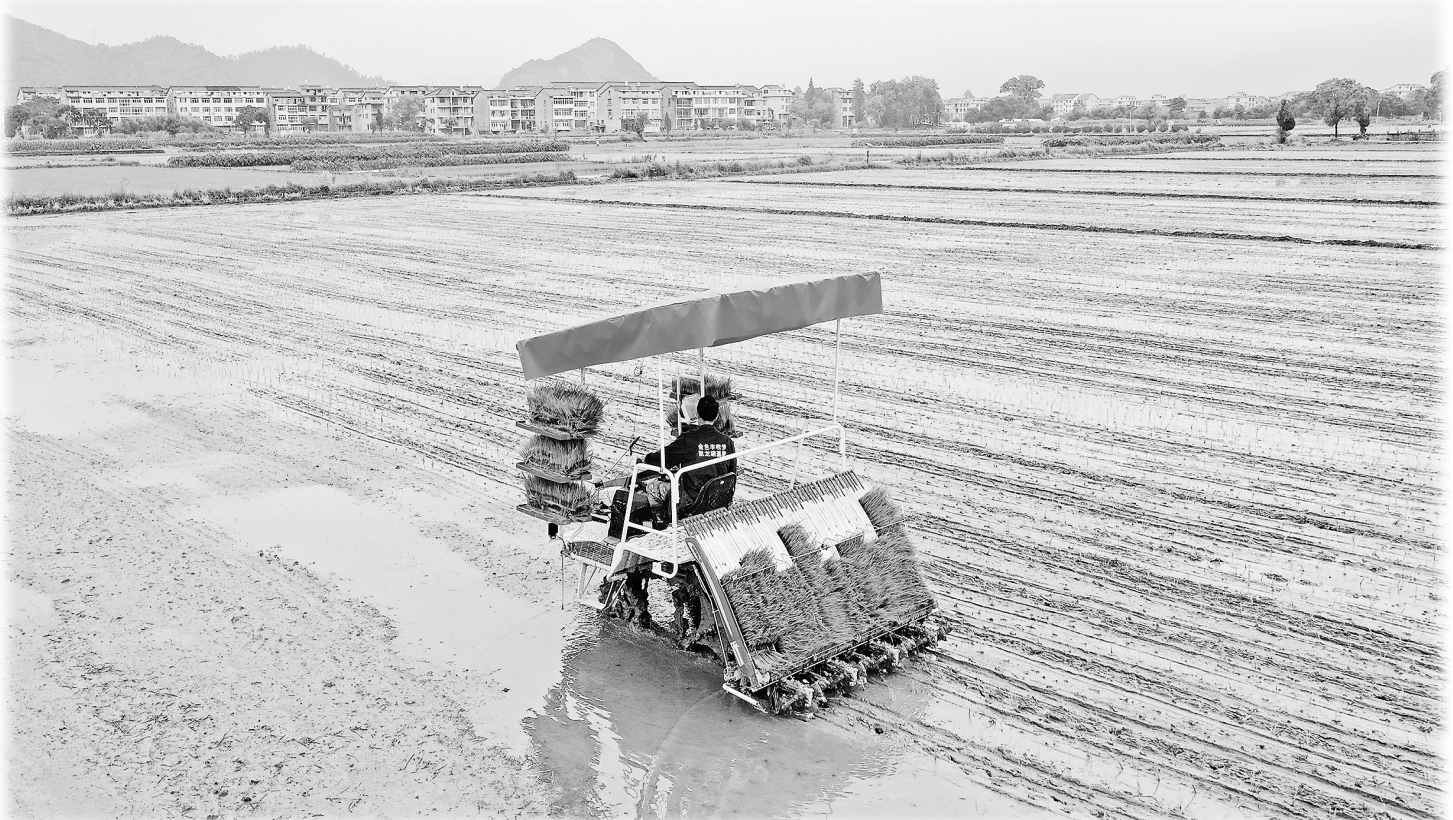
6月19日,在浙江省临海市永丰镇,农民驾驶插秧机进行插秧作业。