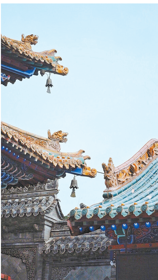
纪信祠一角

楹联是汉语言对句艺术、民俗文化、书法艺术与制作技艺四大要素相结合的产物,其中蕴含的道德教诲、人生哲理、家国情怀等,对于传承和弘扬中华优秀传统文化有着积极的作用。秦州大地人文历史深厚,古今名人在亭台楼阁等多处留下许多为当地山水增色的楹联。在这里,让我们共同追溯这些精彩楹联里的秦州记忆。