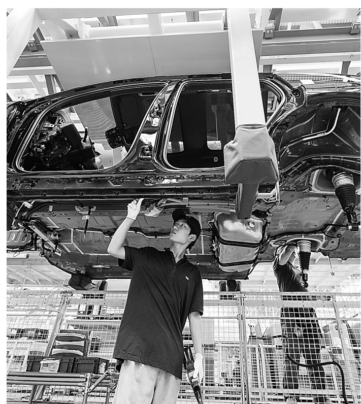
近日,工作人员在位于常州市武进区的江苏常州理想汽车智能制造基地总装车间工作。

后续,该船组将进一步开展设备调试、负荷试验和倾斜试验等工作,计划于年内投入国内最宽内河沉管隧道——广东佛山市顺德区伦桂路工程潭洲隧道的建设。