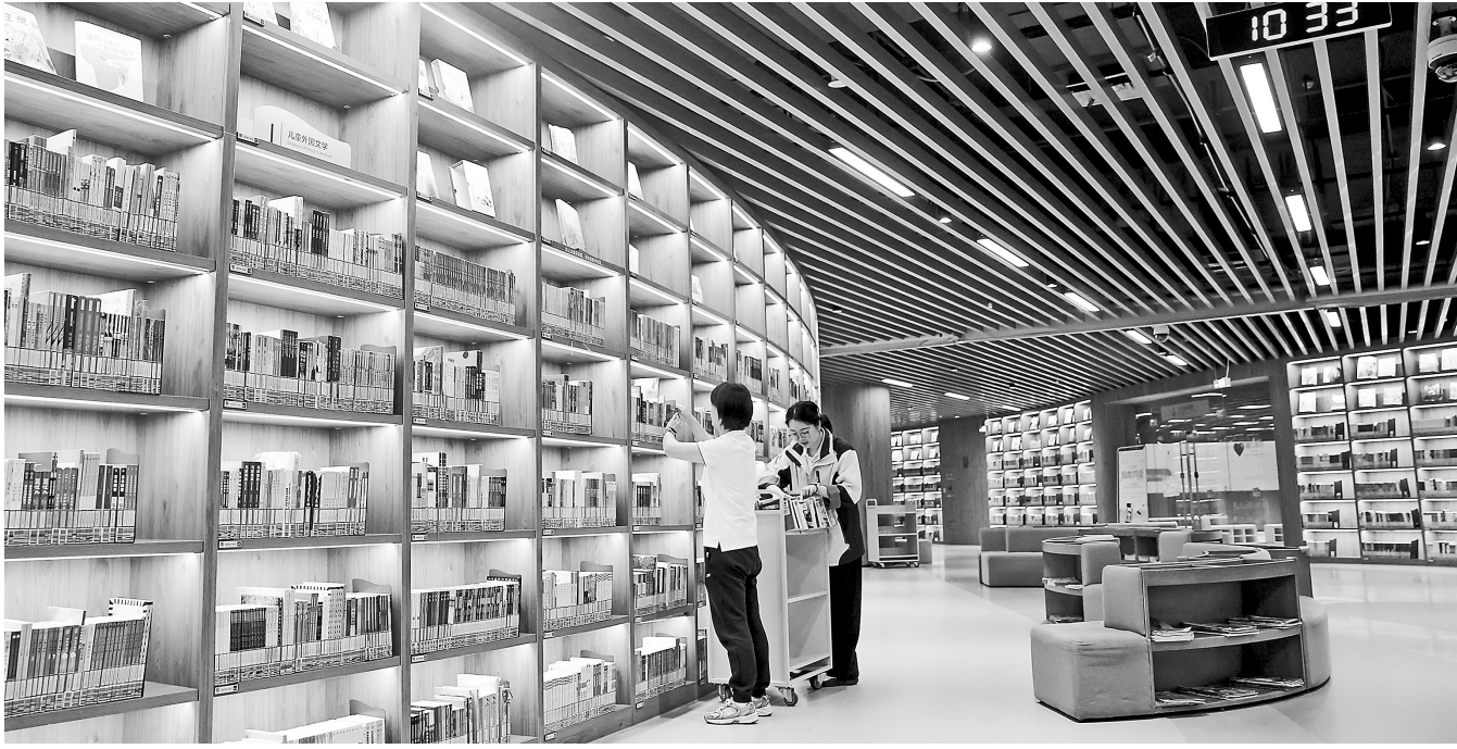
6月12日，在位于浙江嘉兴市艺术文化中心的秀洲区图书馆，馆员在整理图书。

二是坚持科技支撑，发挥“外脑”作用。充分依托“益心为公”志愿者检察平台和兰州市检察机关“公益诉讼大数据应用平台”收集长城保护线索，拓宽公益诉讼案件线索来源渠道。兰州市检察院将公益诉讼大数据平台抓取到的“老鹳村烽火台”受损线索交办皋兰县检察院后，皋兰县检察院综合运用大数据支持、无人机等技术辅助线索研判，固定证据，在深入研判的基础上向皋兰县文旅局发出诉前检察建议，推动遗址恢复原状，并对附近村民进行法治教育。其后，为推动长城文物保护公益诉讼专项工作走深走实，形成全社会保护的共识和氛围，提升案件办理效率，皋兰县检察院依托“益心为公”志愿者检察云平台招募志