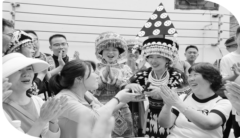
△在云南水富市两碗镇三角村,身着苗族服装的当地人向游客敬上苗家米酒。 ▷在江苏省扬州市何园景区,小朋友们和工作人员一起包粽子。

到祖国山川领略大美中国、伴着端午文化尽享舌尖美味、宅在家中享受快递之便……在刚刚过去的端午假期,国内文旅、餐饮、零售等市场需求增长、人气旺盛,夏日消费热力涌动。