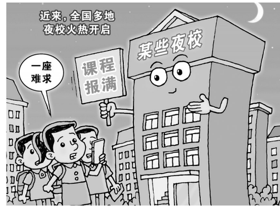
一座难求! 新华社发