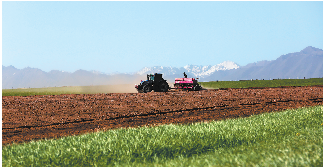
芒种时节,山丹马场二场18万亩牧草进入全面播种期。

当前我省土地墒情受本轮降雨天气影响,出现明显好转,陇东旱作区、陇中旱作区、河西灌区、陇南旱作区等4个类型地区的土壤墒情整体适宜。