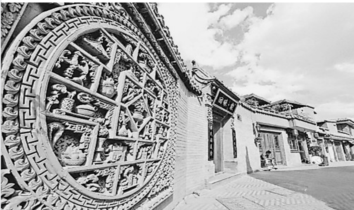
巷道里精美的砖雕

砖雕之最。全景图上的场景与八坊十三巷肌理高度吻合,无论身处十三巷的哪个位置,都能在砖雕的全景图上找到对应点。人物、建筑处处彰显着八坊人的民俗文化,而展现在周边的则是积石滩关、黄河大坝、牡丹长廊、松鸣岩等河州八景。