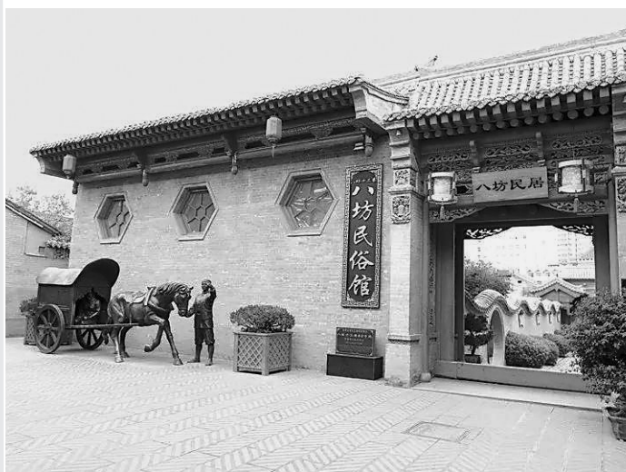
八坊十三巷民俗馆

这里不是江南古镇,却有它的韵味;这里不是成都锦里,却处处充满灵气……街道、店铺和民居依旧保持着传统的布局,漫步于此,感觉在历史的画卷中徜徉,浓浓乡愁、浓浓亲情、勃勃生机在这里散发着安静而内敛的悠久气质。这里就是独具民族特色的临夏八坊十三巷。