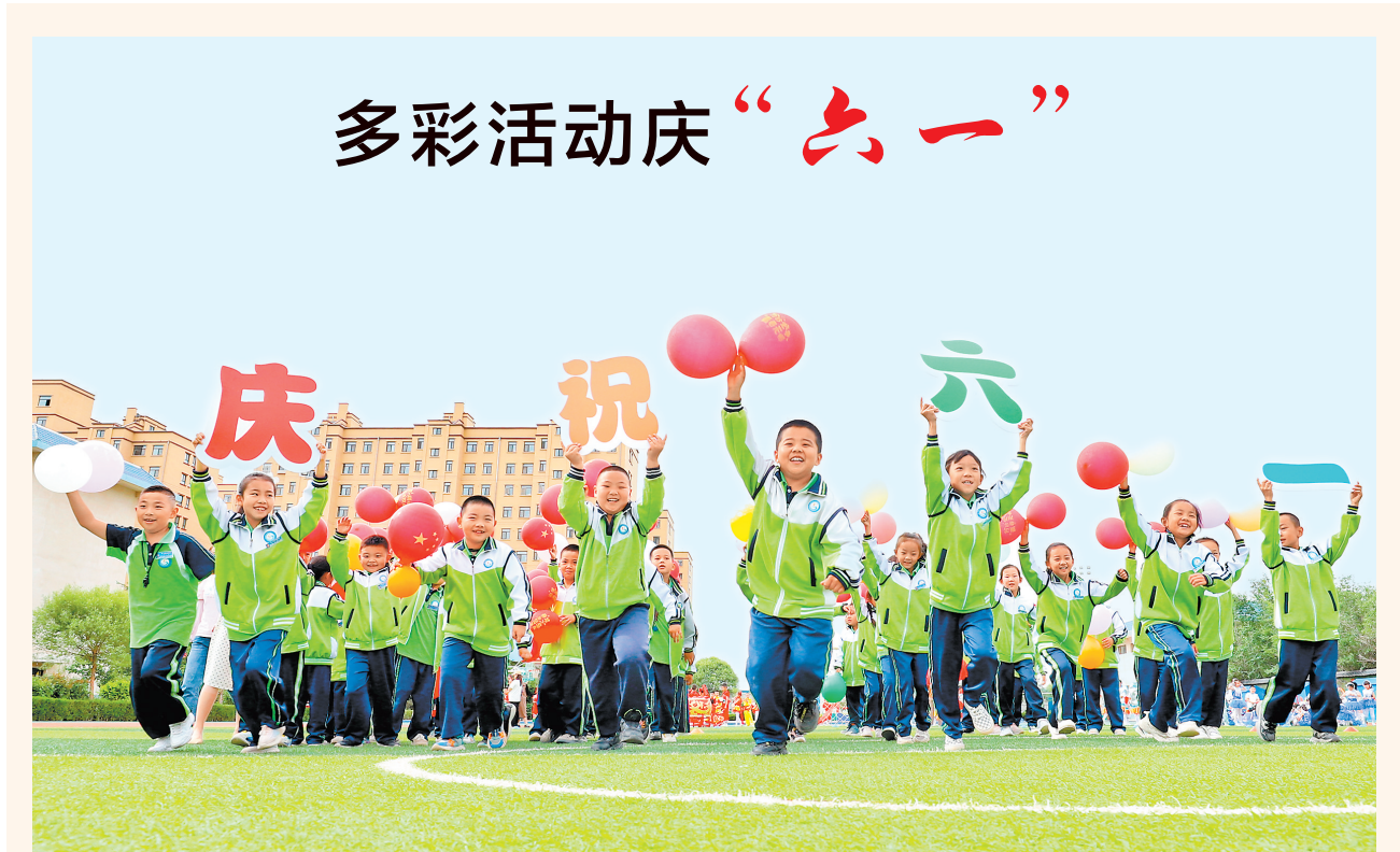
张掖市甘州区甘泉街小学的同学们在操场上表演节目,庆祝“六一”国际儿童节。

平凉市纪委监委推动在全市范围内拉网式排摸各类工作群,建立《移动互联网应用程序清单目录》,进一步严格建群行为,全面清理合并作用不大、职能重叠的网络工作群,及时注销或解散临时性、阶段性网络工作群。规范政务新媒体使用行为,落实登记备案制度,建立管理台账,常态化开展清理规范,全面减轻基层干部负担。(转2版)