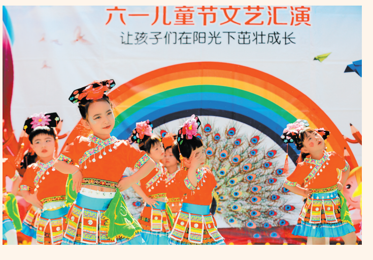
六一儿童文艺汇演