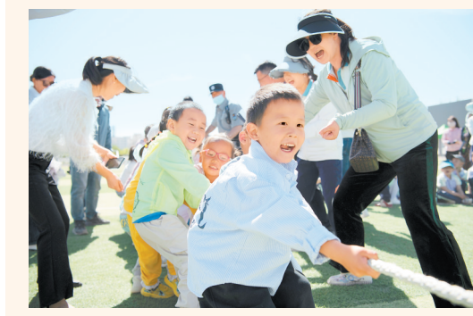
△阿克塞县幼儿园孩子们在进行拔河比赛。