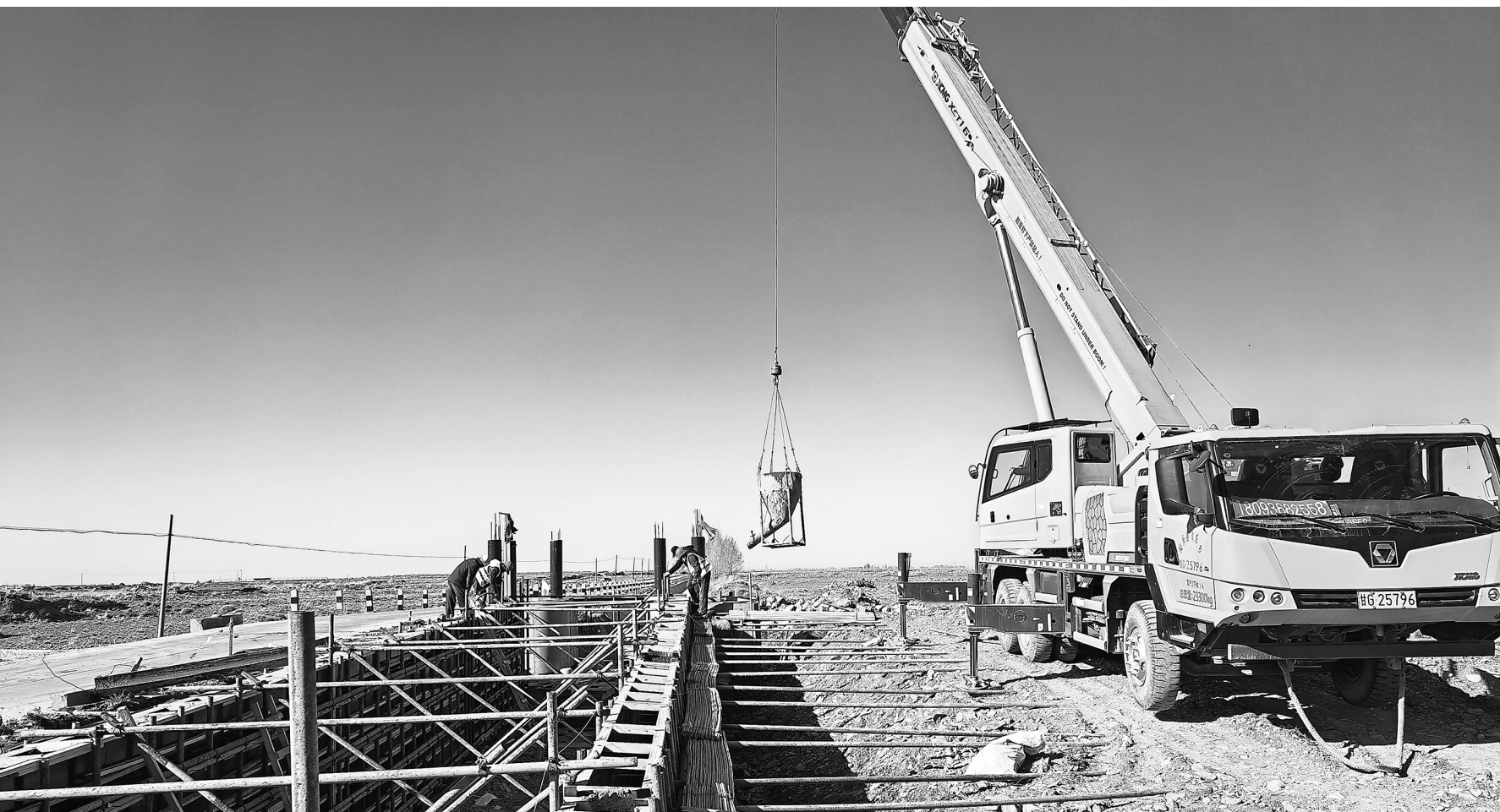
连日来，在民乐县大塔麻大型灌区续建配套与现代化改造项目建设现场，大型机械来回穿梭，工程有序推进。据悉，民乐县大塔麻大型灌区承担着全县6个乡镇共60个行政村的灌溉任务，设计灌溉面积39.595万亩。新甘肃·甘肃日报通讯员 王晓涇

据统计，今年一季度，甘肃中药材出口值1776万元，同比增长55.29%，出口市场拓展至韩国、日本、美国等11个国家和地区。