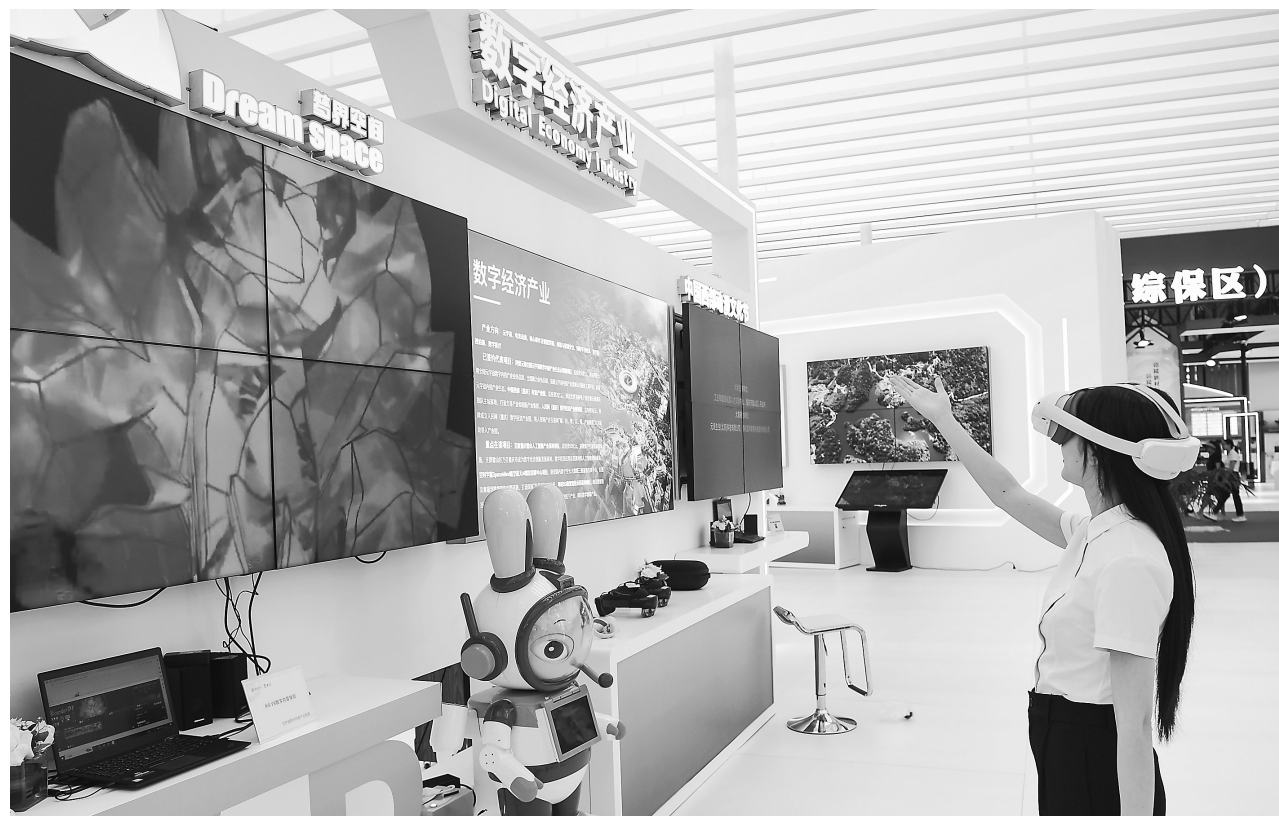
5月23日，观众在西洽会重庆璧山馆体验VR。当日，第六届中国西部国际投资贸易洽谈会在重庆国际博览中心拉开帷幕。