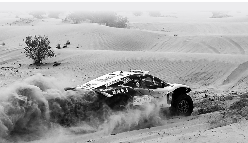
5月23日，2024年中国环塔国际拉力赛完成第三赛段比赛。