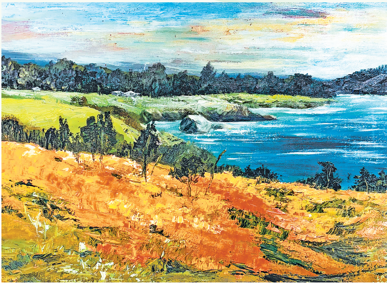
遍地流金自生香 芦鹏