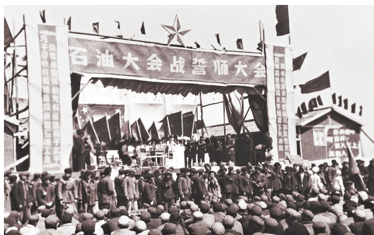
1960年4月29日,石油大会战誓师大会在大庆召开。

王进喜不但崇尚实干,还强调工作要认真细致,对质量要一丝不苟,要经得起检验。在大庆会战初期,王进喜曾经带过的1205钻井队,打斜了一口井,王进喜主动向会战领导作了深刻的检讨,还组织干部工人打斜了一口井,王进喜主动写下耻辱的一页,可王进喜却说:“没有这一页队