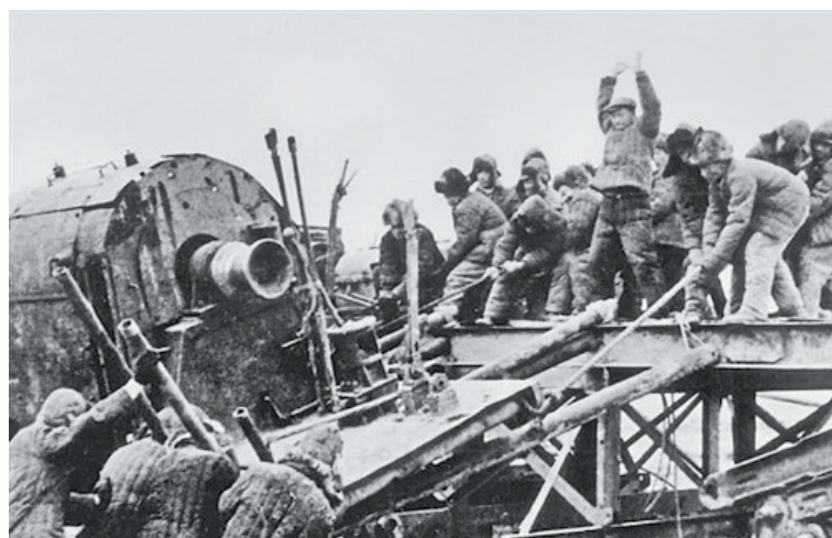
1960年4月,初到大庆的王进喜组织大家用“人拉肩扛”的办法搬运设备。

史就是假的,这一页不仅要写在队史上,还要写在我们每一个人的心里,我们要让后人知道,我们掉掉的不光是一口井,还填掉了低水平、老毛病和坏作风。”