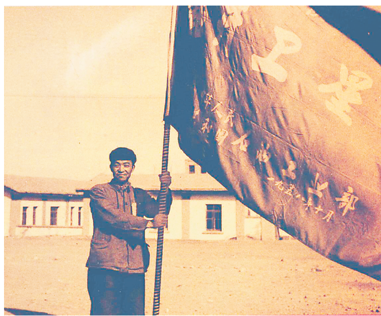
1958年10月,贝乌五队被授予“钻井卫星”称号。