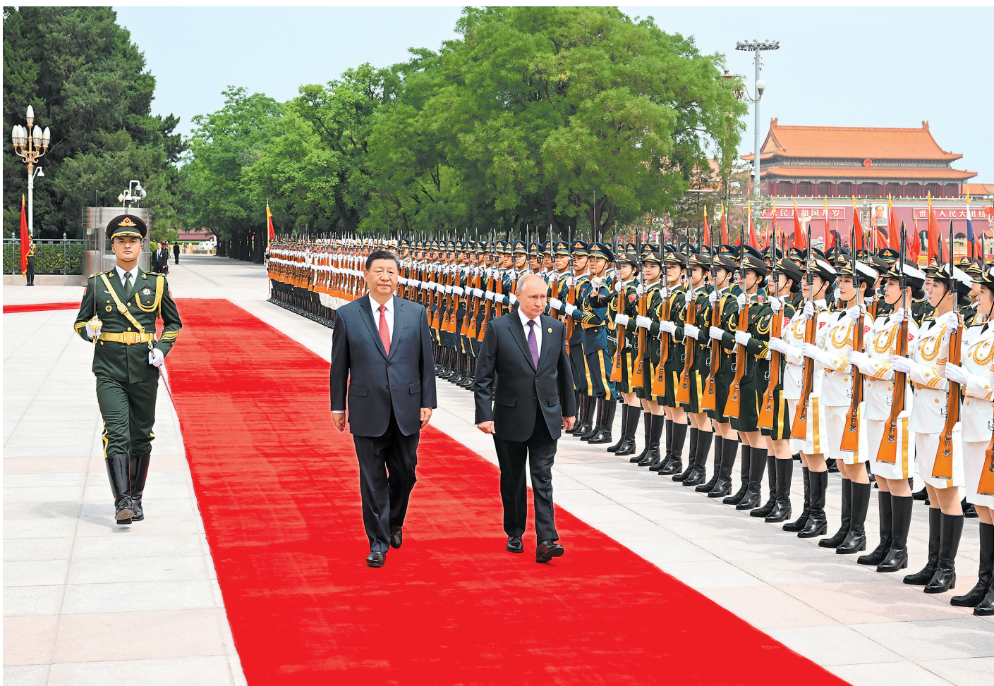
5月16日上午,国家主席习近平在北京人民大会堂同来华进行国事访问的俄罗斯总统普京举行会谈。这是会谈前,习近平在人民大会堂东门外广场为普京举行隆重欢迎仪式。