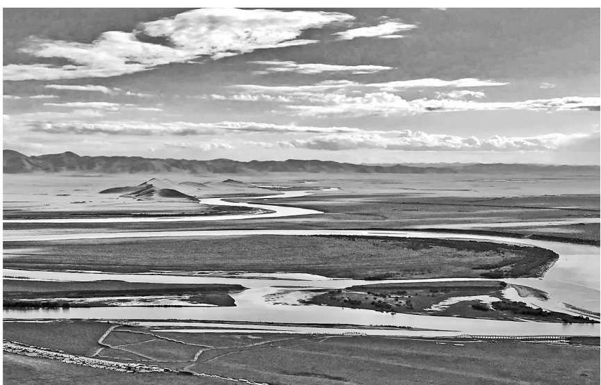
黄河九曲第一湾 资料图