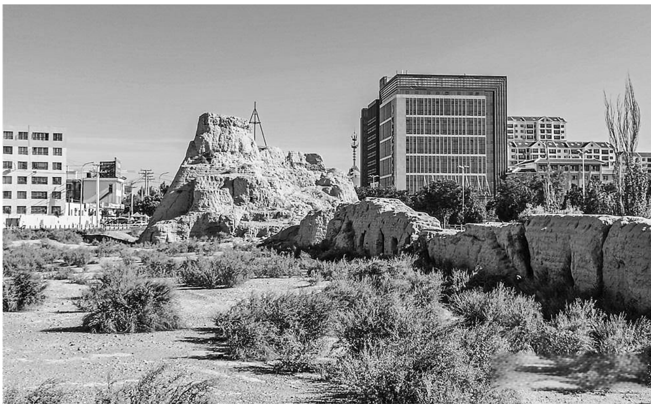
沙州郡城遗址公园一角