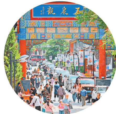
天水玉泉观景区吸引众多游客。