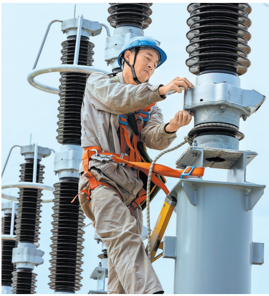
“五一”期间,电力建设者在江苏泰州500千伏海阳变电站施工现场进行避雷器安装作业。