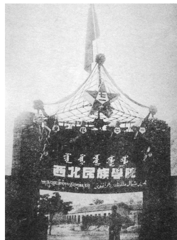
1950年8月,西北民族学院在兰州正式成立。

增加6.5倍,达到346个,其中医院87个;病床增加7.8倍,达到1441张;卫生医药技术人员增加2.4倍,达3535人。文化事业得到较快发展。1949年至1952年,新成立电影放映单位20个,全省电影放映单位达30个;新增艺术表演团体7个,艺术团体达44个;新建文化馆20个,文化馆达76个;新华书店55处,新创办报纸12种,发展广播转播、收音站300余处。1951年成立甘肃人民出版社,1952年出版图书93种,达431万册。全省增加2个科研机构,26名科技人员。人民群众能够较好地享受到文化事业发展的成果。