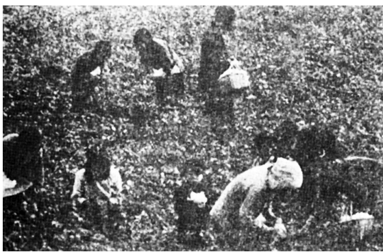
天水甘谷六峰区妇女变工组在摘棉花。(《甘肃日报》1950年10月30日第3版)

在建立和发展以国营为主导的公有制经济的同时,省委、省政府认真贯彻“公私兼顾、劳资两利、城乡互助、内外交流”的方针,积极帮助私营工商业复工复产,恢复和发展生产;认真贯彻执行中央对私营工商业的各项政策和法令,对工商业者进行政策教育的同时,采取一系列措施予以帮助。1949年9月30日至10月4日,兰州市军管会召集工商界人士及工农代表座谈会,宣传党的商业政策、金融政策、税收政策以及人民币的性质作用。同时,采取多种措施,积极帮助私营工商业户解决原料供应、产品销售等方面的实际困难,通过行政手段,取缔违法经营,限令复工复产或转产转业。1950年初,兰州市对50余户私营毛纺织业给予复工贷款,10月,又给予45家毛纺织业、8家制革业、35家印刷业、4家制皂业以及其他一些私营工业户共112家发放复工贷款。对经营国计民生重要商品的私营商业,如土产、皮毛、粮食、纱布等,除给予贷款支持外,还适当地减免税收,鼓励其发展。由于省委、省政府制定和实施帮助私营工商业的正确政策,具体措施落实到位,全省所有复工复产的私营工商业,均在很短时期内恢复生产经营,并取得了发展,对全省经济的恢复起到重要作用。据统计,1949年8月,兰州市及各专区所在地工商户数达7383户。到1950年底增加到51103户。截至1951年底,全省私营工商业发展到63147户,其中私营工业增加5342户,私营商业经营户增加6702户。