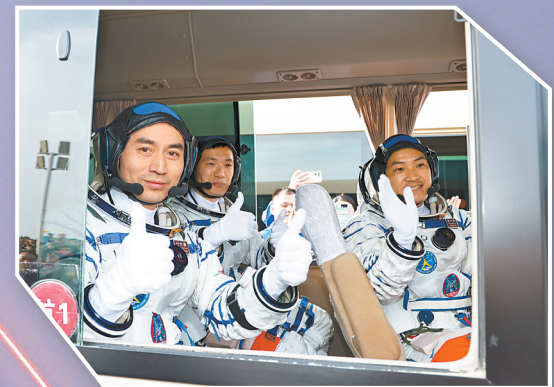
航天员叶光富、李广苏、李广苏出征。