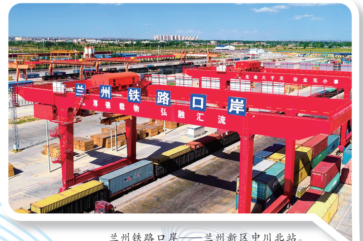
兰州铁路口岸——兰州新区中川北站。