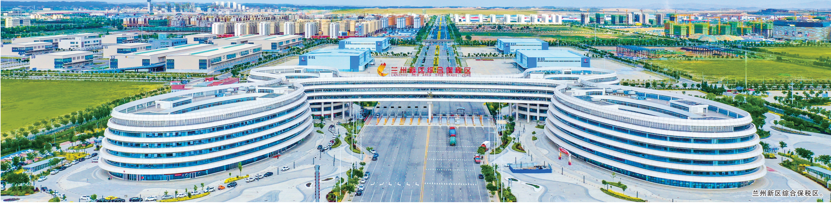
兰州新区综合保税区。