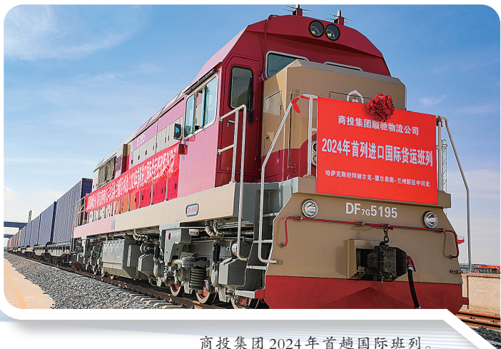
商投集团2024年首趟国际班列。