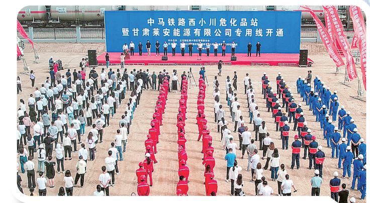
2023年8月,兰州新区西小川危化品站开通运营。

七年奋进,铸刻辉煌;承载使命,再启新程。站在高质量发展的新起点,商投集团将抢抓机遇,聚焦提高发展质量和效益,以新的风貌迎接新的挑战,以新的举措破解新的难题,以新的思路谋求新的发展,着力完善多式联运物流枢纽体系,不断优化产业链供应链,加快培育临空经济产业集群,积极构建现代城市服务体系,谱写全省商贸物流行业高质量发展的新华章。