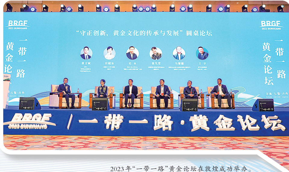
2023年“一带一路”黄金论坛在敦煌成功举办。