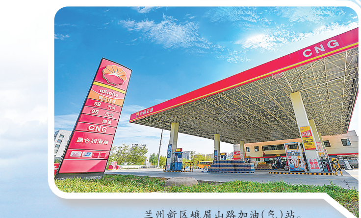
兰州新区峨眉山路加油(气)站。