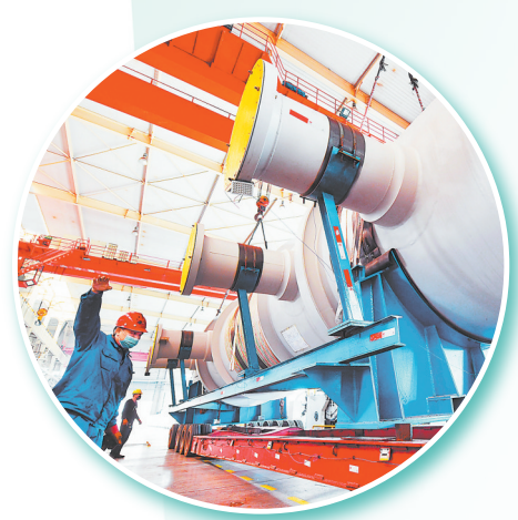
兰石集团重装备公司加工车间。(资料图)

省发展改革委相关负责人表示,将按照省委、省政府决策部署,抢抓施工黄金期,深入推进重大项目“百日攻坚”行动,更大力度强化项目储备,更大力度用好政府投资,更大力度激发民间投资,为稳定全省固定资产投资增长、推动全省经济社会高质量发展作出积极贡献。