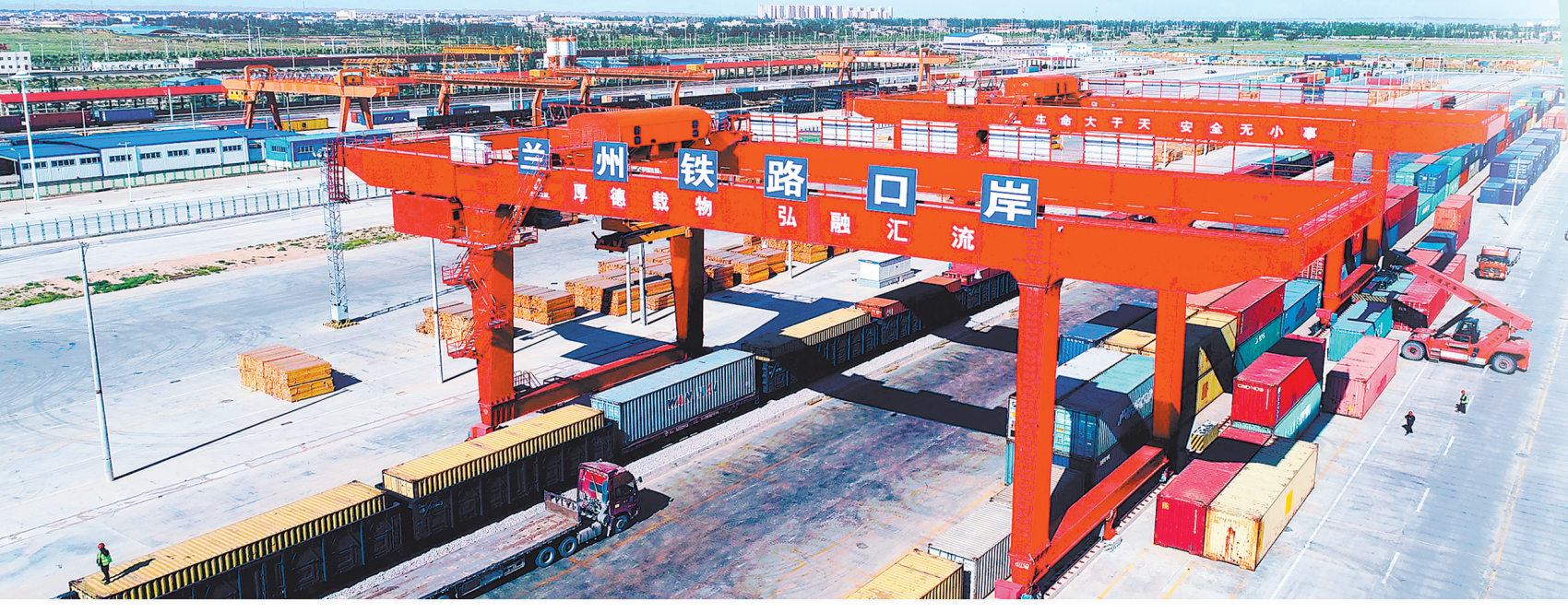
兰州新区北站物流园。(资料图)