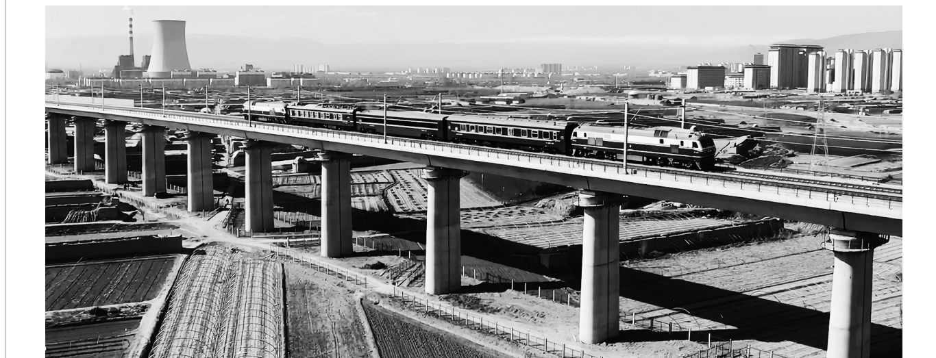
中国建筑承建的兰张三四线铁路兰武段5标段目前已完成全部主要施工任务。该段全长49公里,主要建设内容包含路基22.7公里、桥梁9座、连续梁10处、制梁架586幅、车站1处。图为兰张三四线铁路兰武段联调联试。