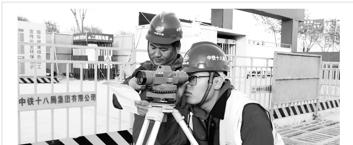
中铁十八局三公司津冀管理部河道三标项目部积极开展“传、帮、带”“导师带徒”活动。图为项目部技术导师指导徒弟使用测量仪器。

下一步,甘肃电信还将依托中电医健持续深耕医疗健康行业,结合国家战略性新兴产业发展要求,积极探索医疗健康行业数据运营和医疗行业大模型,为建设“数字中国”和“健康中国”添砖加瓦、贡献力量。