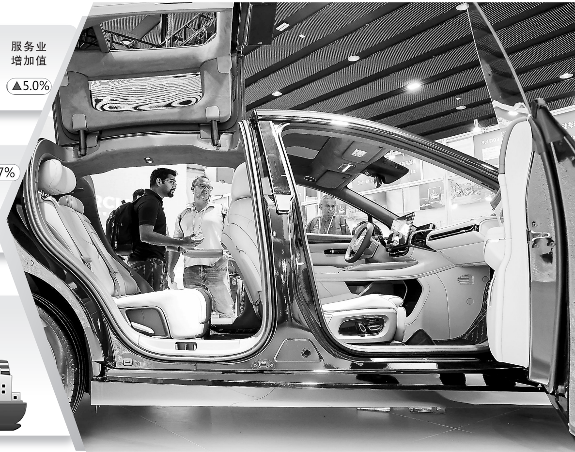
第135届中国进出口商品交易会近日开幕,采购商在参观中国新能源汽车。

入低位增长,部分企业运营承压……在感受到复苏暖意的同时,不可否认,当前中国经济仍面临一些困难挑战。