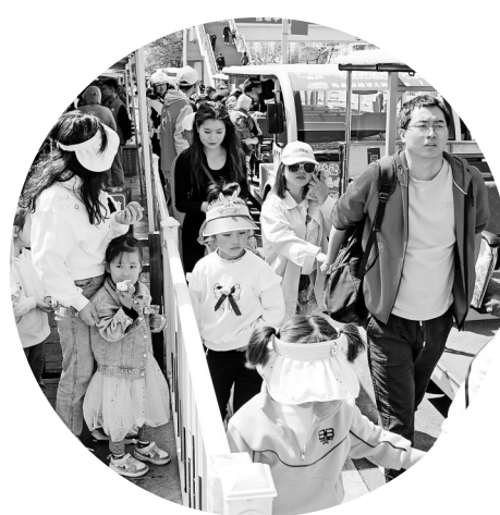
在天水中华西路步行街游客免费观光车接送点,游客正在排队上车。

4月13日、14日,恰逢周末,天水的麻辣烫迎来又一个高峰。在天水中华西路步行街游客免费观